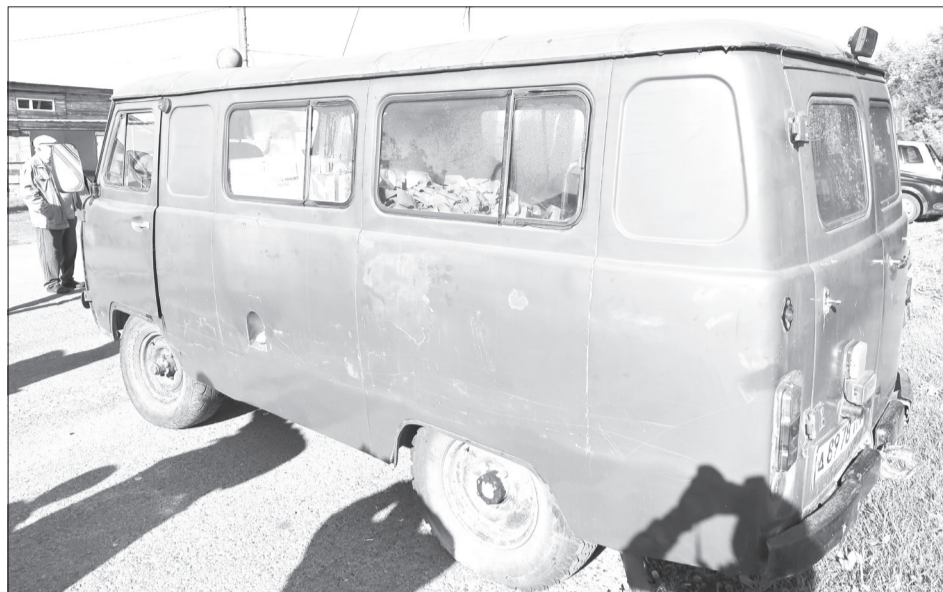
Перед отправкой автомобили привели в полное рабочее состояние