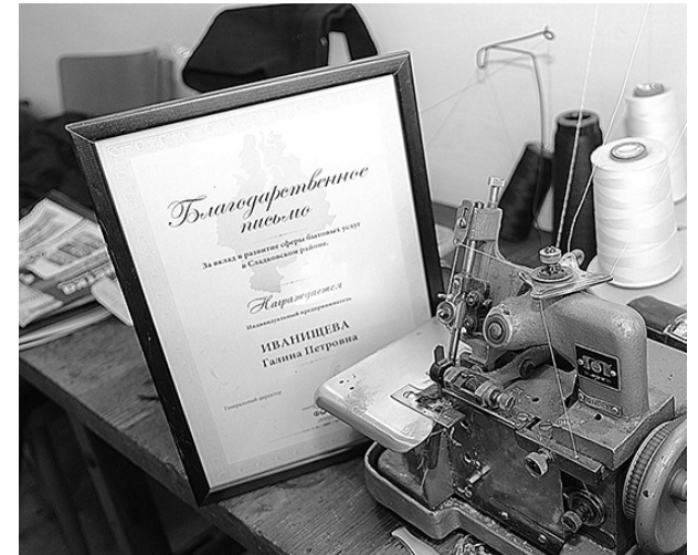
* Одна из наград

— Да, безусловно. Для такой ткани требуется специальная обработка. Стараюсь и с ними работать, — отвечает швея.