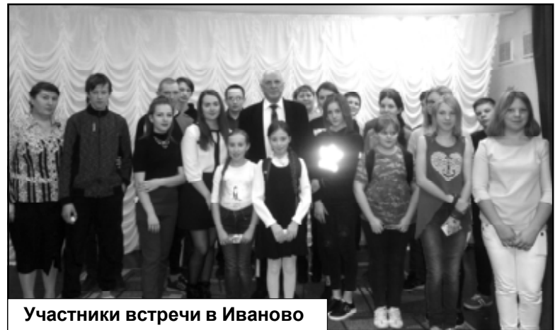
Участники встречи в Иваново

задавали вопросы, интересуясь его работой над стихотворениями, их тематикой и жизненным кредо собеседника. Да и «стимул» был – авторов самых интересных тем ждали пять экземпляров новой книги поэта «Переменная солнечность».