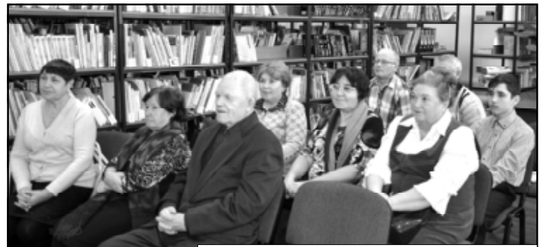
Разговор получился душевным...