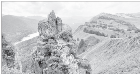
До скалы Чёртов Палец можно добраться на лошади или квадроцикле. Но лучше это сделать пешком, ведь виды здесь потрясающие