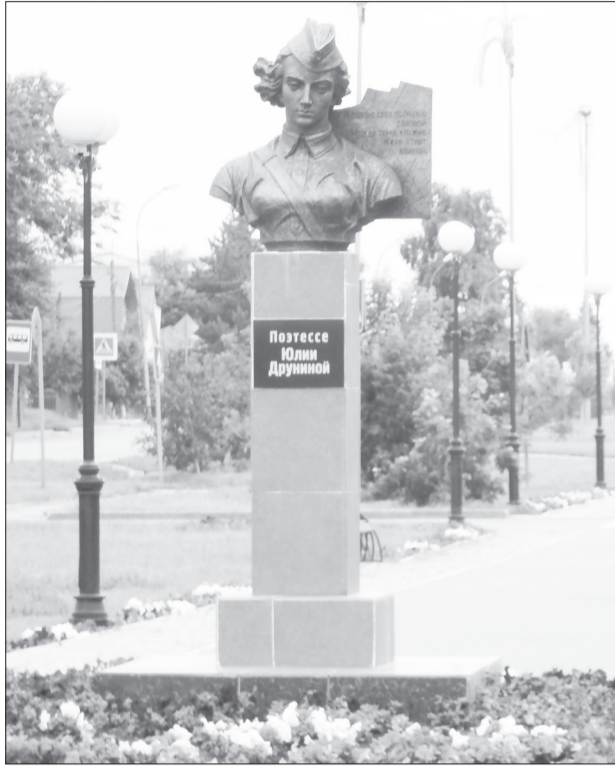
Памятник поэтессе в сквере её имени. Г. Ялуторовск, 2015 г.