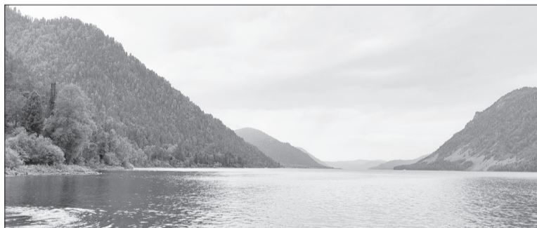
Телецкое озеро занимает второе место после Байкала по глубине (323 метра), а его главной достопримечательностью является водопад Корбу