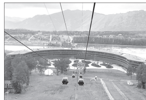
Манжерок - крупнейший горнолыжный курорт Алтая