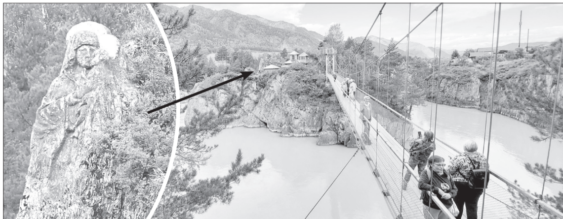
Образ Богородицы, высеченный на скале острова Патмос, нужно хотя бы раз увидеть вживую

Местные особенности. В путешествиях впечатления накрывают лавиной, и, чтобы всё лучше запомнилось, Саша при-