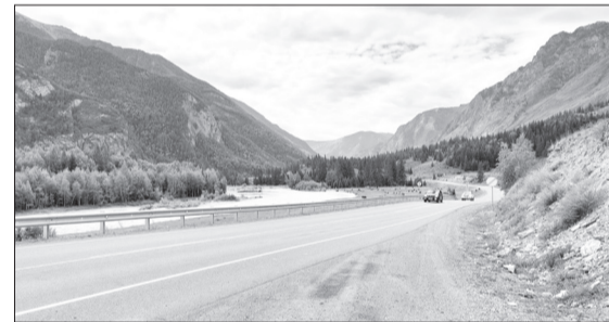
Чуйский тракт считается одной из пяти самых красивых дорог мира. В этом списке она единственная из России