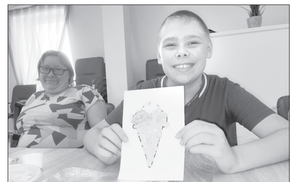
Совместные занятия приносят радость детям и их родителям /ФОТО ПРЕДОСТАВЛЕНО АНО «ПРИСТАНЫ ДОБРЫХ ДЕЛ» ①