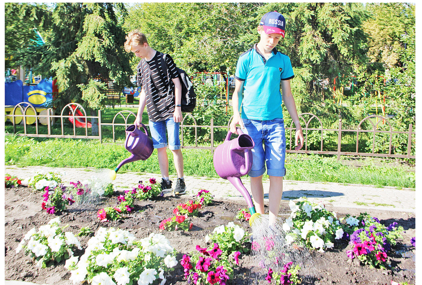
Поливка цветов — обязанность ребят