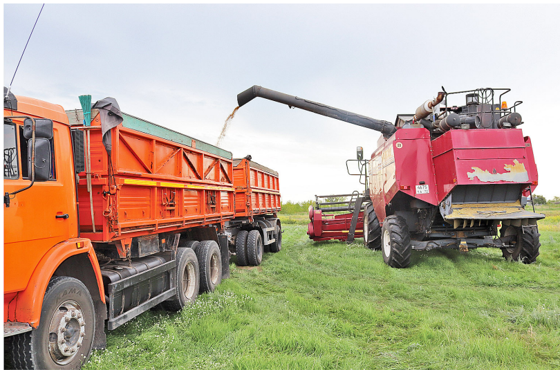
Первые центнеры нового урожая вселяют надежду на хороший конечный результат

— Да, действительно, в рамках внутрихозяйственной модернизации мы приобрели новый зерноуборочный комбайн, два КамАЗа, УАЗы для специалистов и перевозки работников, почвообрабатывающие орудия и сортировочное оборудование для зерносклада. Поскольку наше предприятие специализируется на производстве семян, оно чётко придерживается стратегии обновления сельскохозяйственного парка техники и применения инновационных технологий. Иначе нам не достичь желаемого результата. К тому же у каждого работника есть прекрасная мотивация, что именно ему доверят управление новой техникой. Несмотря на сезонность и отраслевую специфику, мы стараемся круглогодично обеспечить людей работой, сохраняем фонд заработной платы, существует и система материального стимулирования. К примеру, своими силами мы перекрыли