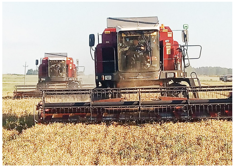
На уборку гороха направлены все техресурсы предприятия