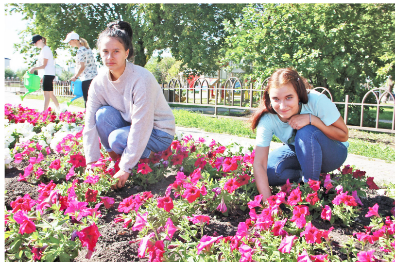
Красивые клумбы в центре села — немалая заслуга и подростков

Анастасия МЕЛЬНИКОВА, педагог-психолог Казанской школы: