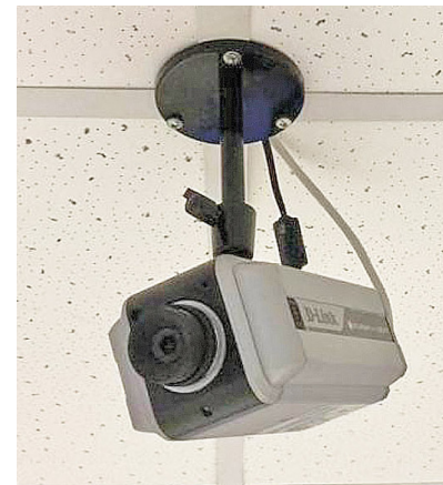
От видеокамеры ничего не утаишь

Как отмечают в ЦИК России, видеонаблюдение на предстоящих выборах впервые будет таким масштабным. Отслеживать ход выборов станут более 10 тыс. камер во всех 85 регионах страны. При этом эксперты сходятся во мнении, что введённые меры контроля повысят доверие граждан к голосованию. Для сравнения: на выборах в Госдуму в 2016 году видеонаблю-