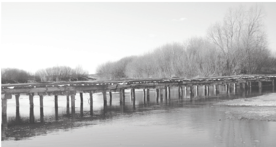
Если в годы половодья вода скрывала мост в с. Коркино, то сейчас он выглядит так.

После 2016 года весенние паводки были слабые. В 2017 году наивысший подъём составил 5 м 2 см, в 2019 г. – 4 м 28 см, 2021 г. – 4 м 20 см.