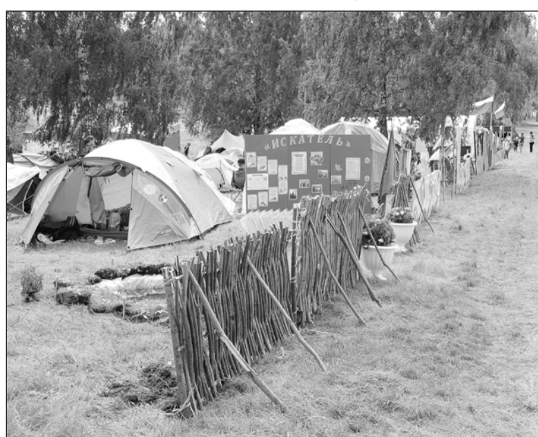
Как ты лагерь обустроишь, так в нём проживешь