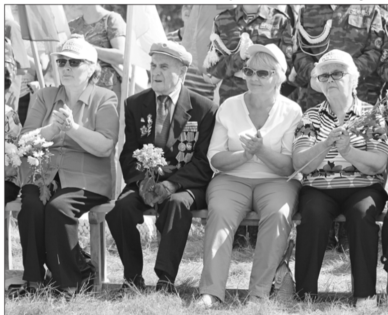
Цветы — для ветеранов