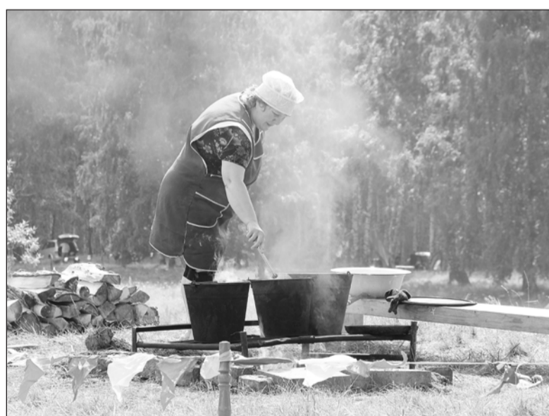
Кто в походе не бывал, тот вкусной пищи не едал