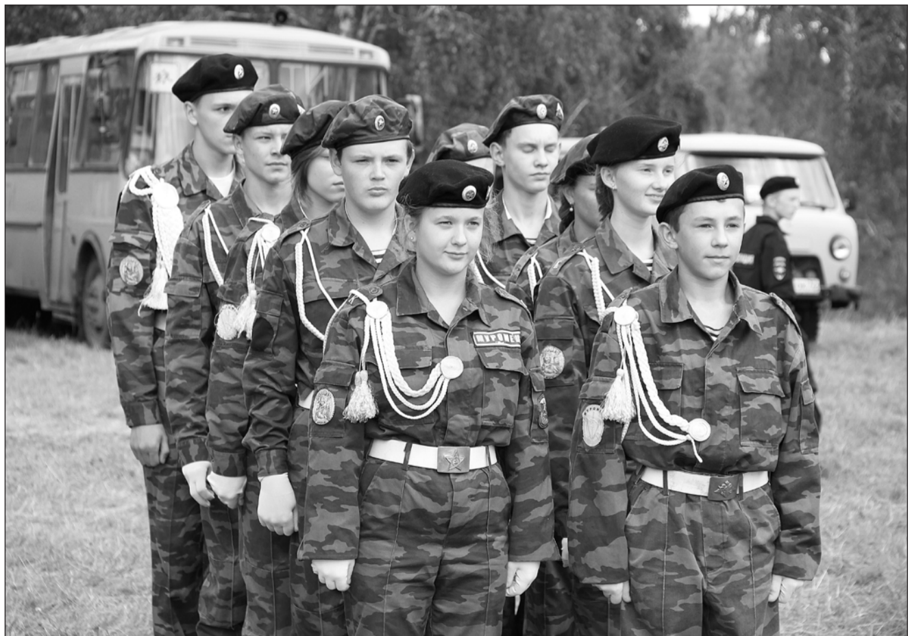
Мы – будущее России