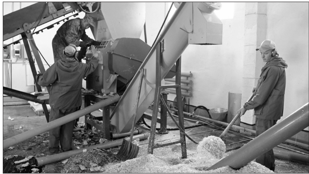
В цехе по переработке пластиковой тары