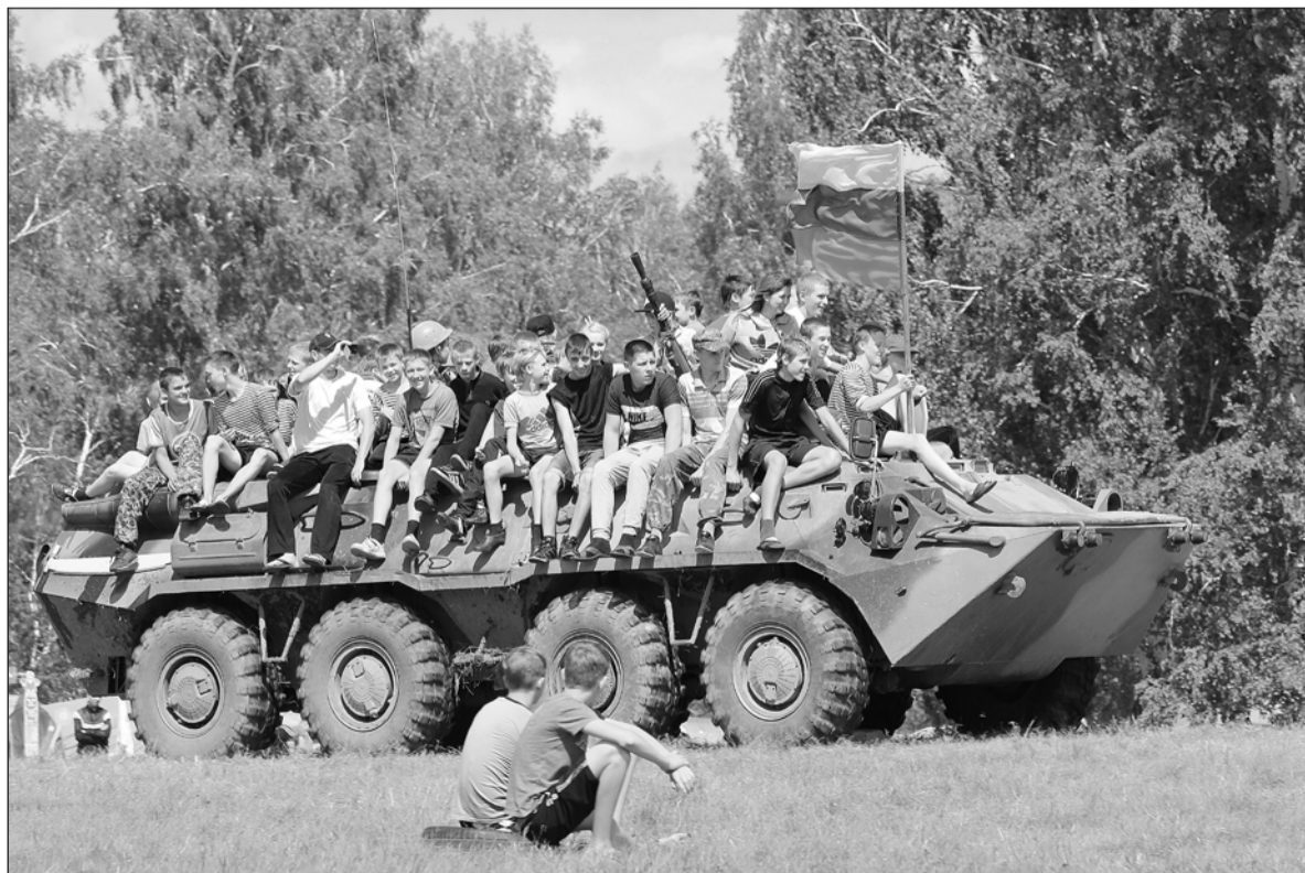
Надёжный оплот страны