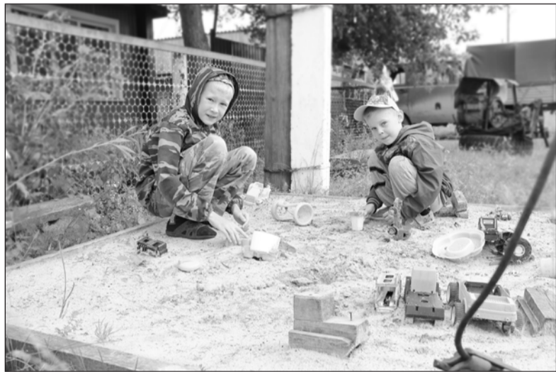
На детской площадке