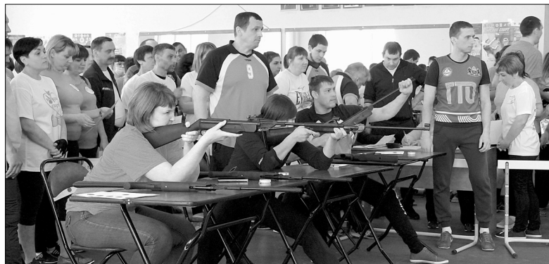
Работники образования метко стреляют из пневматической винтовки