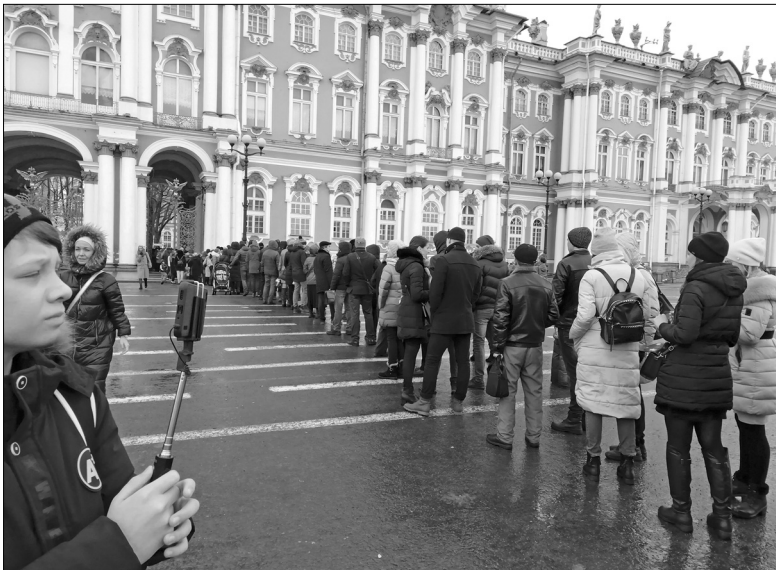
Служители Эрмитажа отмечают, что интерес к сокровищнице русской культуры в наши дни возрос многократно

В два клика мышки купили авиабилеты в самый красивый город мира – Санкт-Петербург. Если постараться, то билеты на самолёт можно найти не дороже железнодорожных. Через сайт забронировали места в хостеле: решили, что гостиничный сервис ни к чему, ведь мы не собираемся сидеть в номере, а хотим увидеть как можно больше. Лететь от Тюмени до Санкт-Петербурга по времени столько же, как ехать на автобусе от Голышманово до Тюмени.