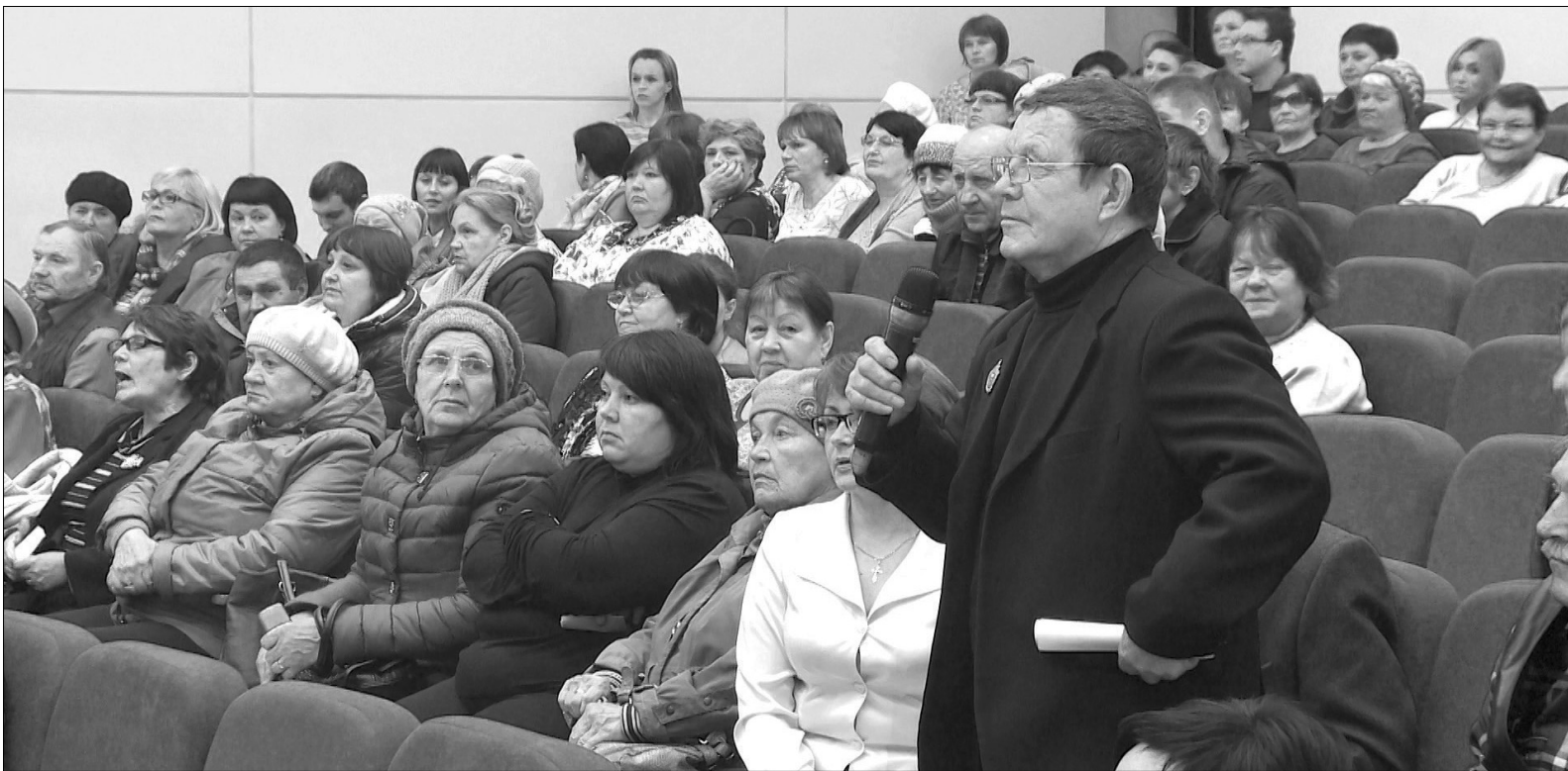
Две основные темы обсуждения на сходе в посёлке – водоотведение и организация вывоза мусора по-новому