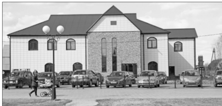
Двухэтажное здание по улице Советской вписалось в единый ансамбль строений между гостиницей «Нива» и зданием администрации района

Наталья ГЛАДКОВСКАЯ.