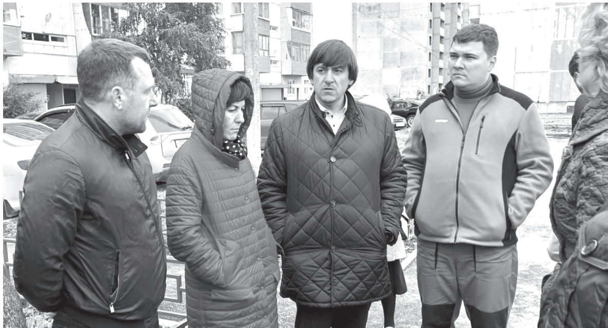
Неожиданная проблема требует взвешенного подхода