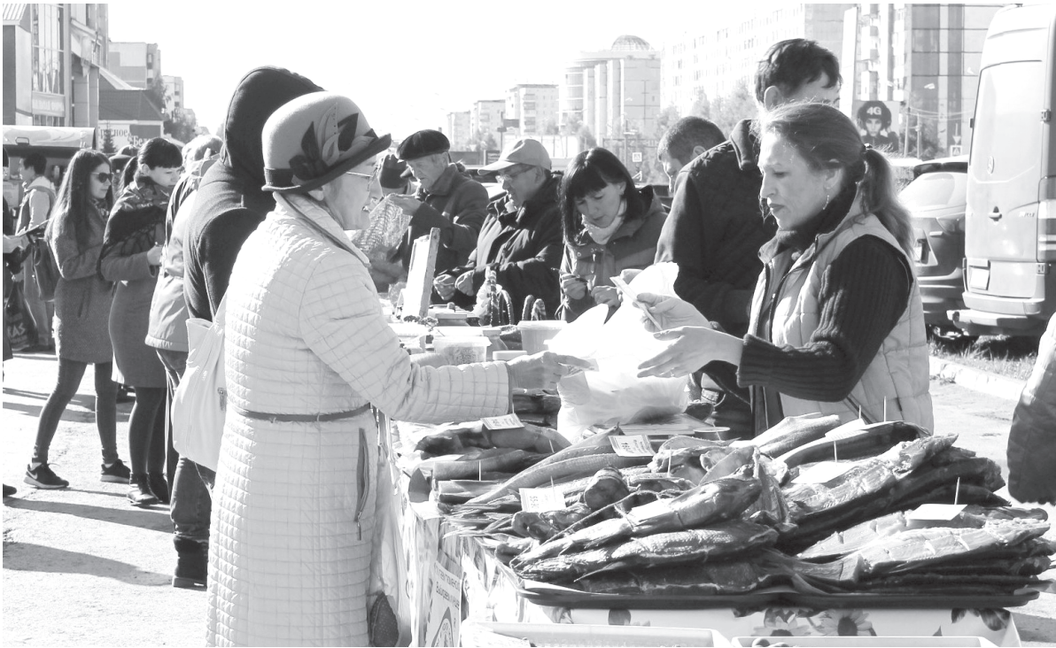
Бойко шла торговля на сельхозярмарке

Будем надеяться, что традиция проведения широких ярмарок всё же возродится в Тобольске.