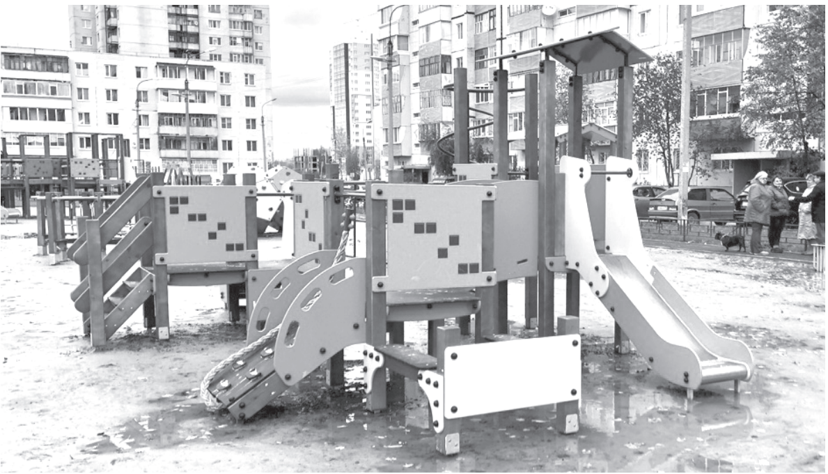
Площадка в 10 мкр. оказалась подтопленной

А городок получился что надо. Всё здесь дышало русским духом: и горки в виде теремка, и качели, и даже лавки так и манили присесть и отдохнуть. С одной стороны, простор для детских игр, а с другой – красиво. Ведь эта территория годами мозолила глаза сломанными качелями и неухоженностью. И увидеть здесь ребёнка было столь же диковинно, как сейчас пустующую площадку. А то, что ещё не доработаны зелёная зона и освещение, это дело нескольких месяцев.