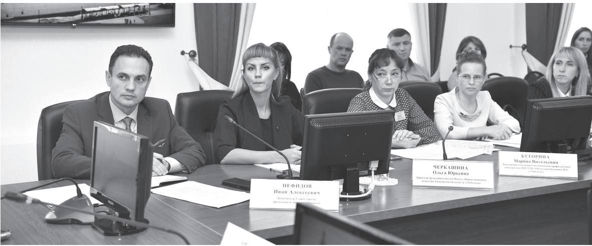
Совет по развитию предпринимательства обсудил единую бизнес-площадку