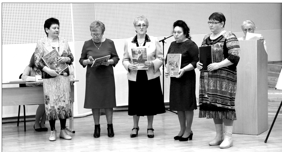
Ветеранские первички представили проект «Трудный хлеб детства». К выпуску готовятся 50 альбомов о детях войны

На пятый конкурс поддержки гражданских инициатив Голышмановского городского округа в направлениях «Активный округ», «Активная среда», «Округ дружбы» было заявлено 44 проекта.