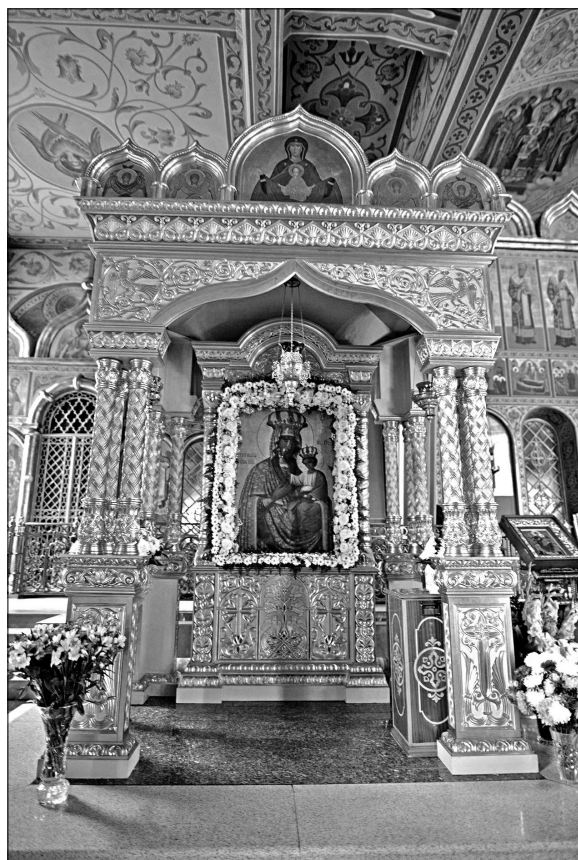
Чудотворная Черниговская икона Божией Матери

С Пасхой Христовой, православные! Выпуск тематической странички «Живница» возобновляем после долгого перерыва, благодарим прихожан, которые в этот раз помогли в её создании, принесли в редакцию свои материалы.