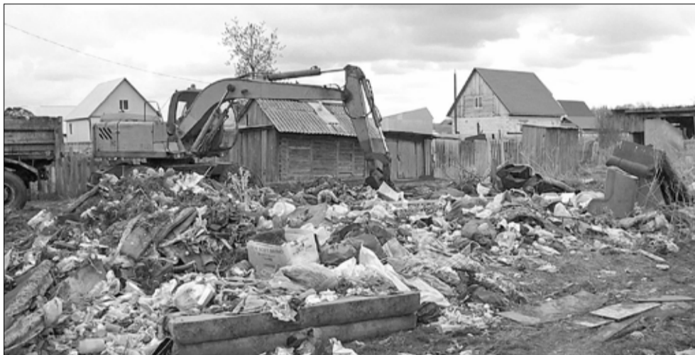
Помойка прямо во дворе многоквартирного дома в микрорайоне Стройгородок-2

На прошлой неделе работники ООО «ГолышмановТеплоСервис» боролись со стихийными свалками в черте района. Одна из них находится в микрорайоне Стройгородок-2. Здесь ежегодно рядом с многоквартирным вырастает помойка на полдвора.