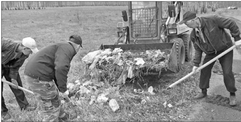
Кучи мусора вдоль всей объездной дороги в залинейной части посёлка Голышманово убирать пришлось коммунальщикам