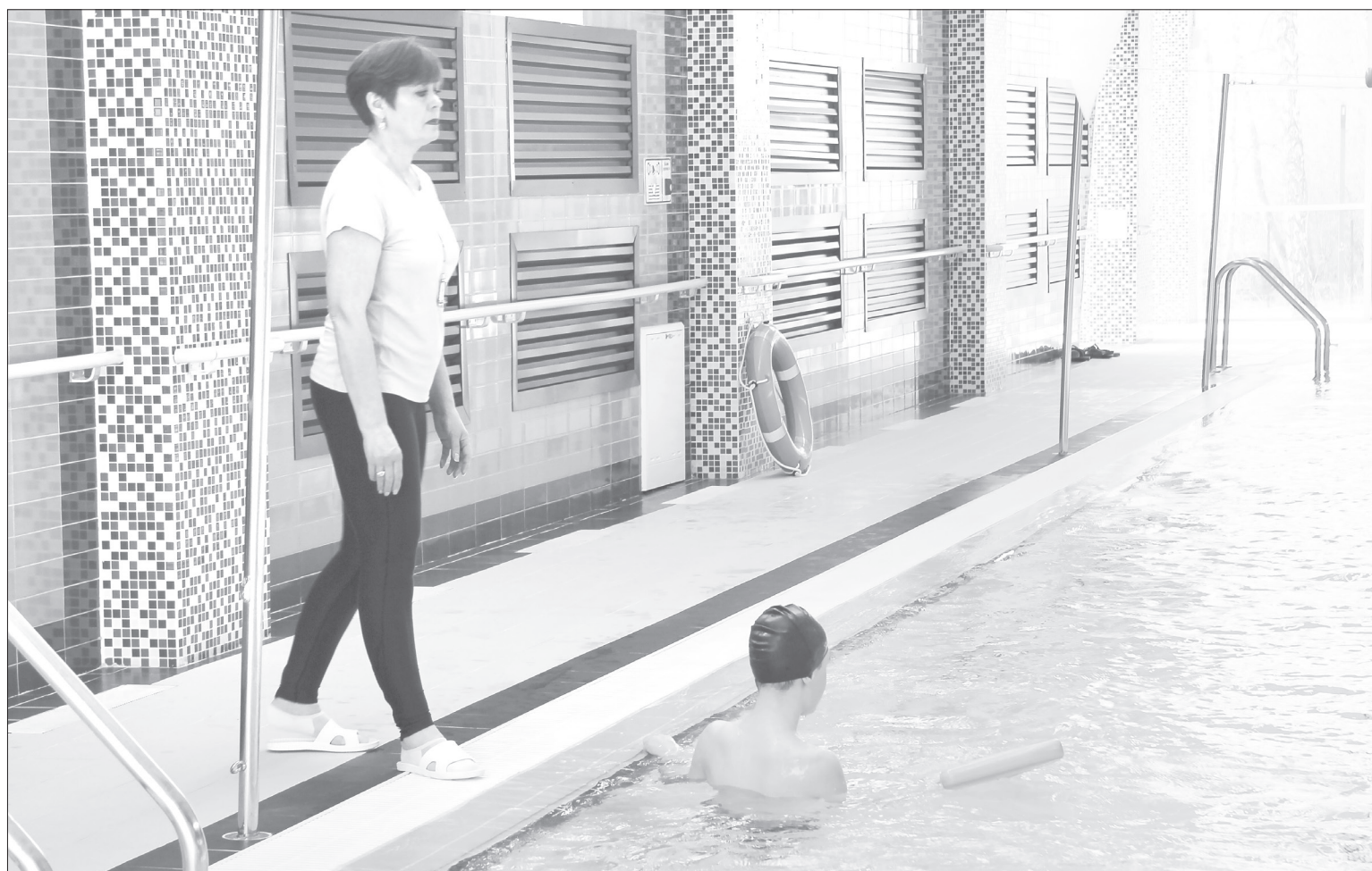
Сейчас инструкторы помогают и подсказывают, но плаванию пока не обучают