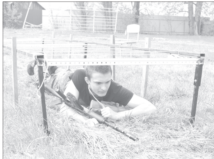
За каждое касание «колючки» - 10 секунд штрафа, к тому же важно выполнить задание максимально быстро

Победителем муниципальной игры стала команда петелинской школы, призёрами - ребята из Памятного и Яра.