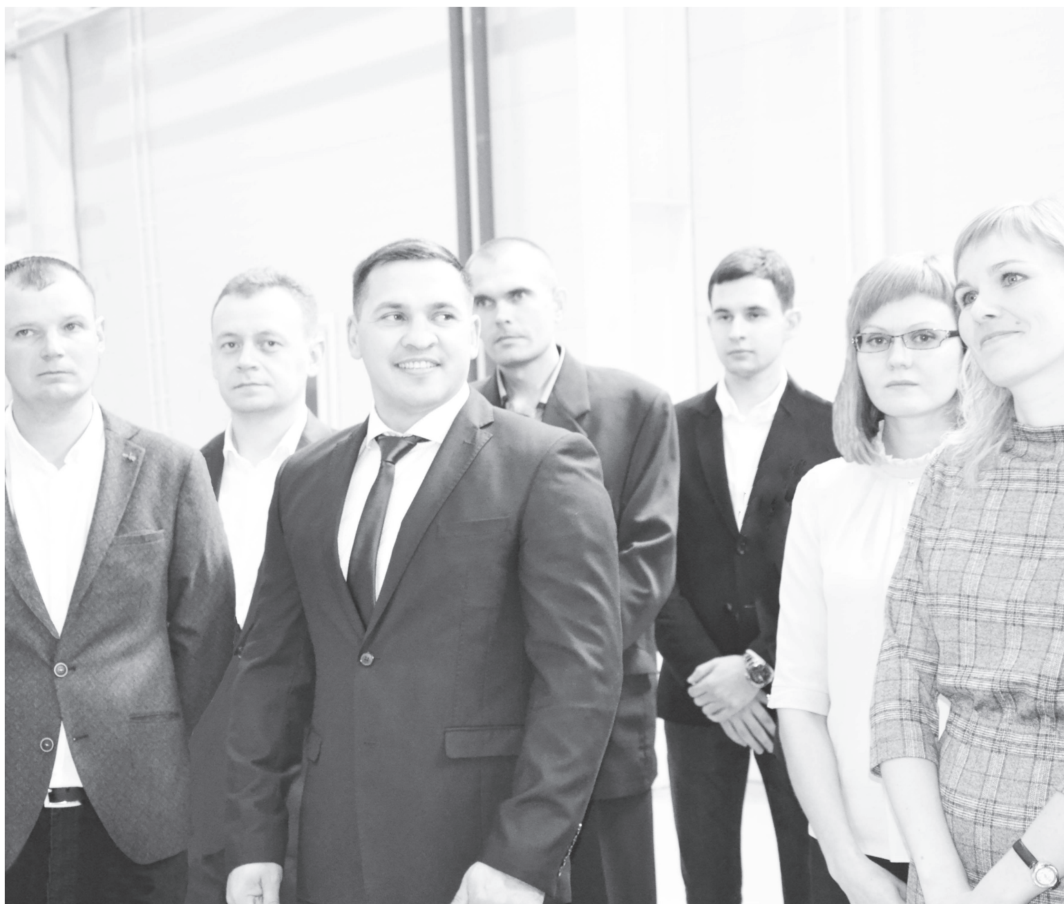
Молодые кадры агрофирмы «КРиММ» отличаются сплочённостью и преданностью предприятию.

Тюменцы отметили день рождения региона. Накануне этой даты Александр Моор провёл пресс-конференцию с журналистами. Губернатор, отвечая на вопросы представителей СМИ, отметил, что, несмотря на введённый режим повышенной готовности, индекс промышленного производства в области составил 128,6 процента – самый высокий по стране.