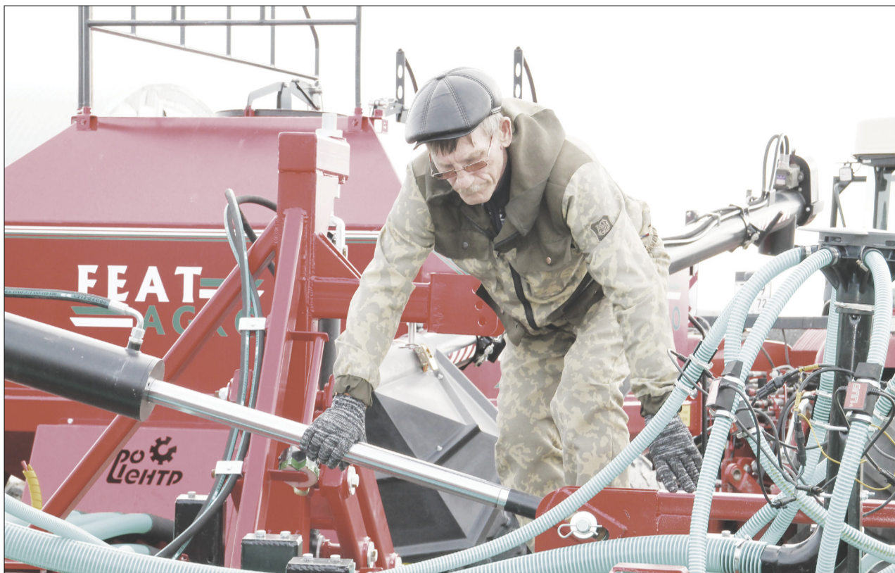
Идёт налаживание посевного комплекса фирмы «Фиат». Не вся европейская техника ушла с рынка.

Александр Моор – губернатор Тюменской области