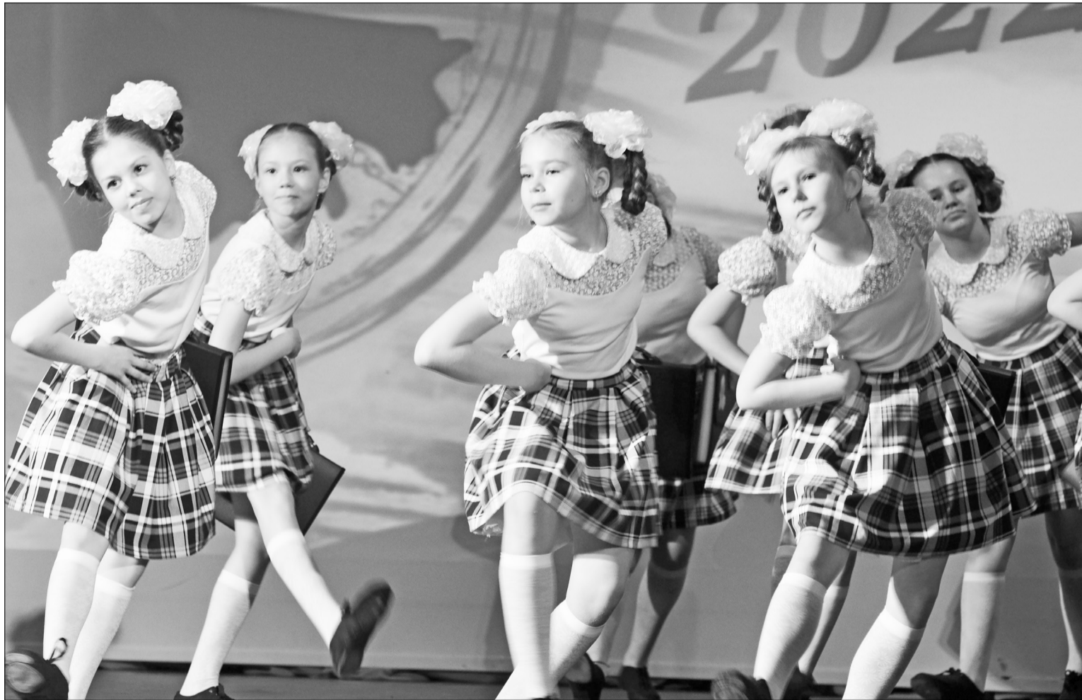
📷 «А нам говорят, что катет короче гипотенузы...» – на сцене ансамбль танца «Улыбка».

Районный фестиваль-конкурс «Танцевальная палитра-2022» прошёл 30 апреля в Нижней Тавде