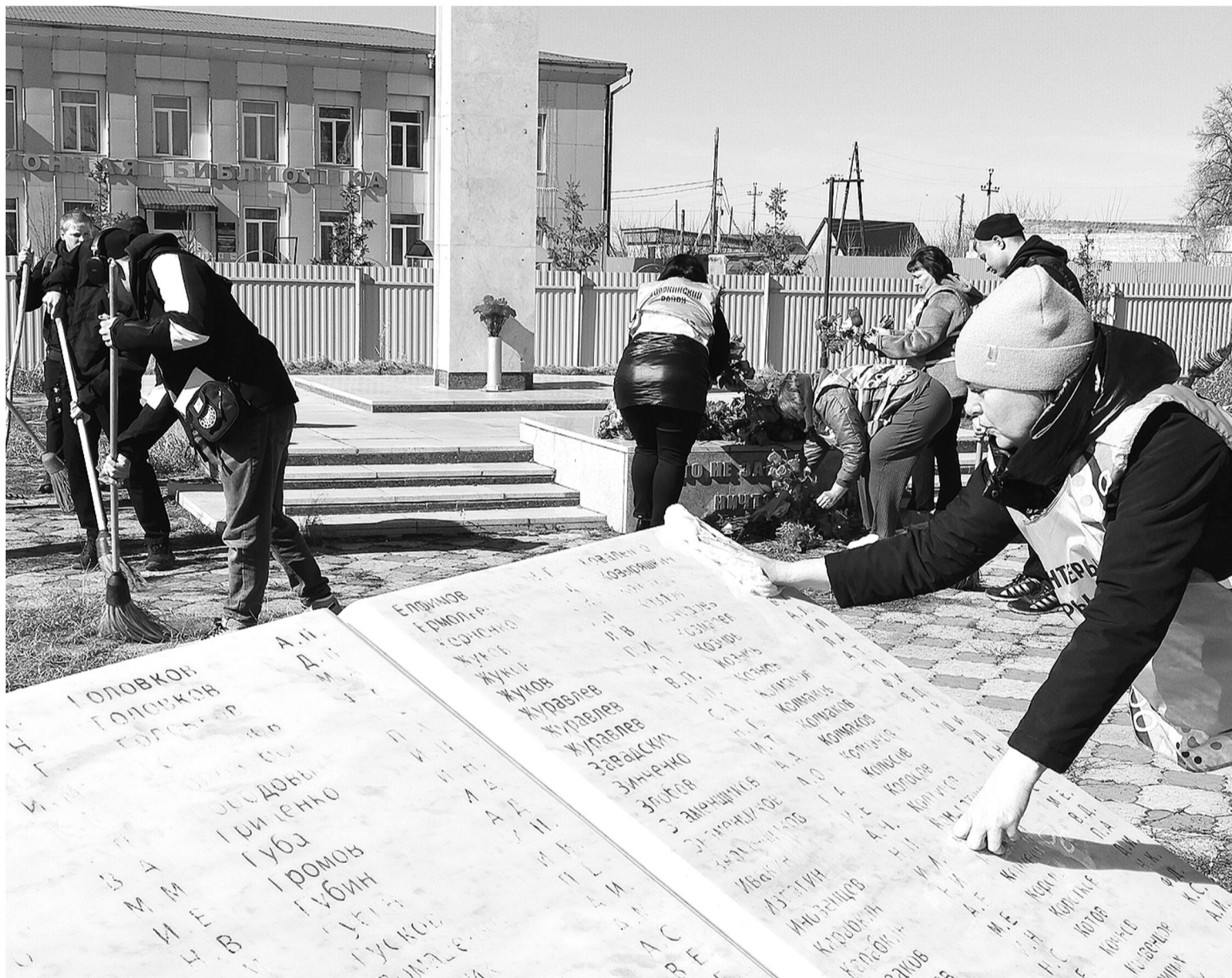
Волонтеры культуры и студенты за работой