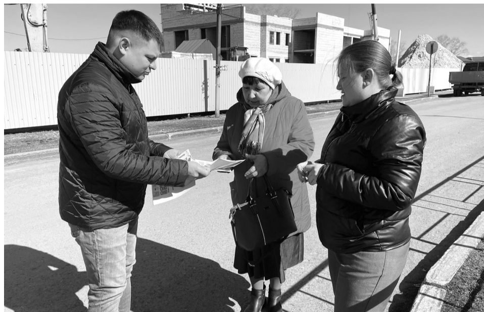
По итогу беседы каждый получил памятку

– семьи, находящиеся в трудной жизненной ситуации или в социально