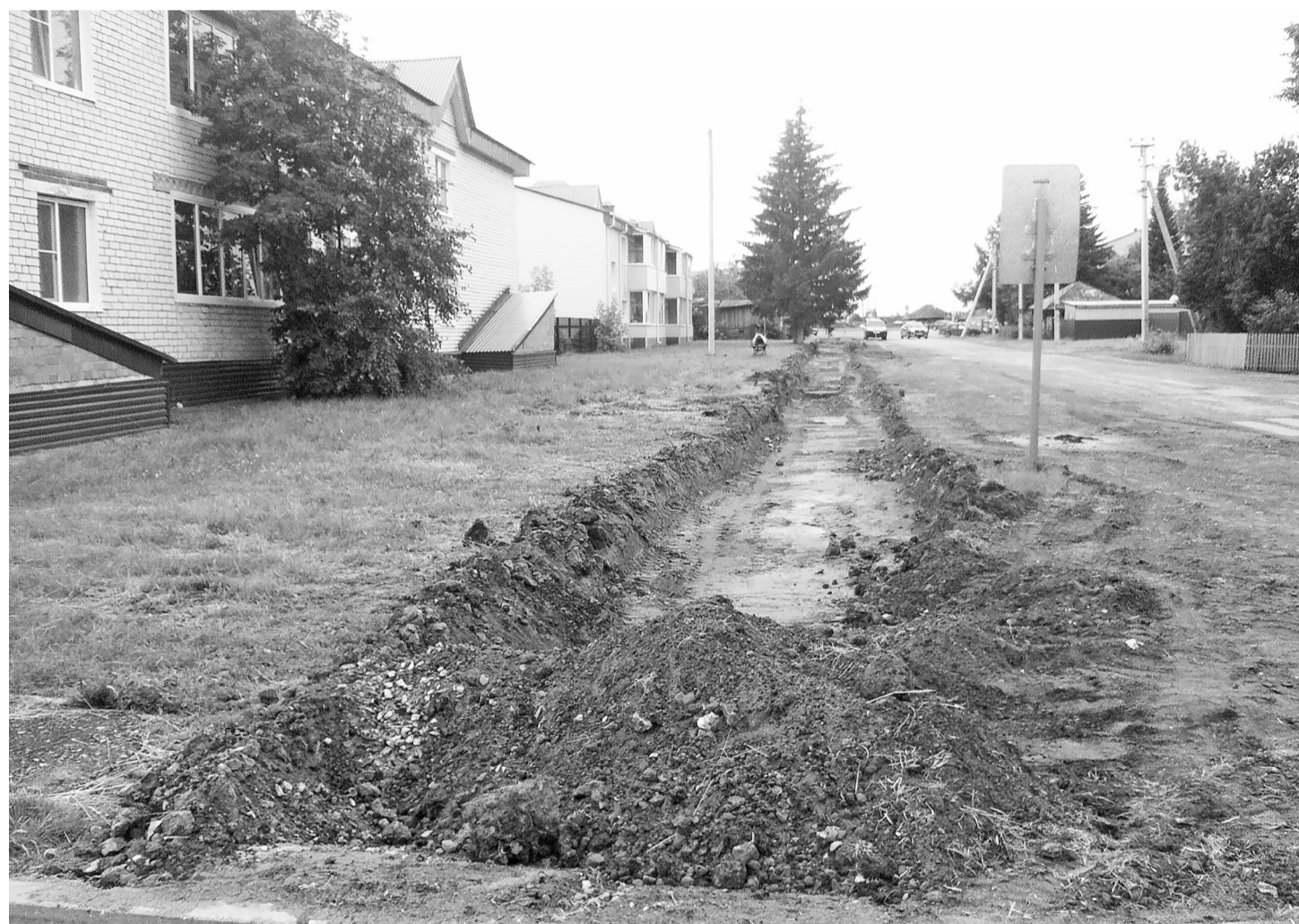
Благодаря новому тротуару проблемный участок дорог Ленина – Дзержинского станет для пешеходов безопасным.