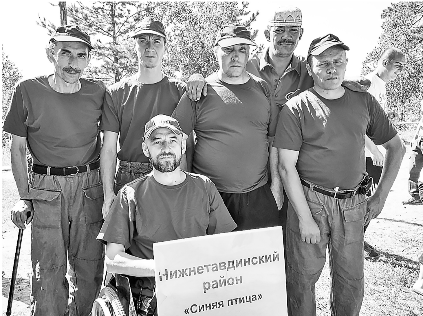
Сильные духом, здоровые телом, с крепкой, стальной головой, не замечая препятствий в дороге, снова отправились в «бой».