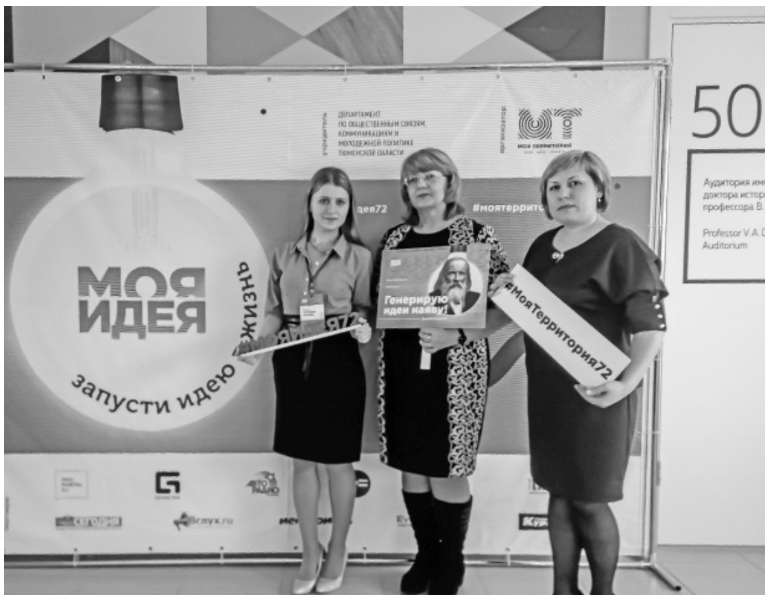
* Сладковский «Молодёжный портал» в числе победителей.

УВАЖАЕМЫЕ РАБОТНИКИ И ВETERАНЫ ПРЕДПРИЯТИЯ БЫТОВОГО ОБСЛУЖИВАНИЯ НАСЕЛЕНИЯ И ЖИЛИЩНО-КОММУНАЛЬНОГО ХОЗЯЙСТВА ТЮМЕНСКОЙ ОБЛАСТИ!