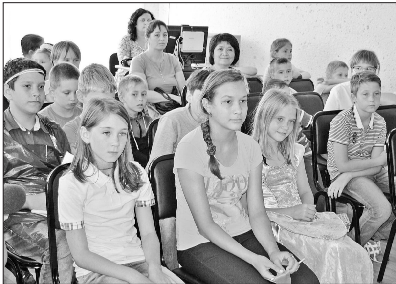
Дети с интересом слушали писателя