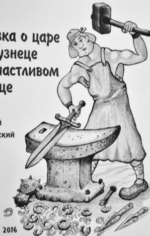
Новое произведение сказочника

новой книги взяли работники районной библиотеки. Сюрпризом для гостей мероприятия и самого автора стала инсценировка школьниками отрывка увлекательного произведения.