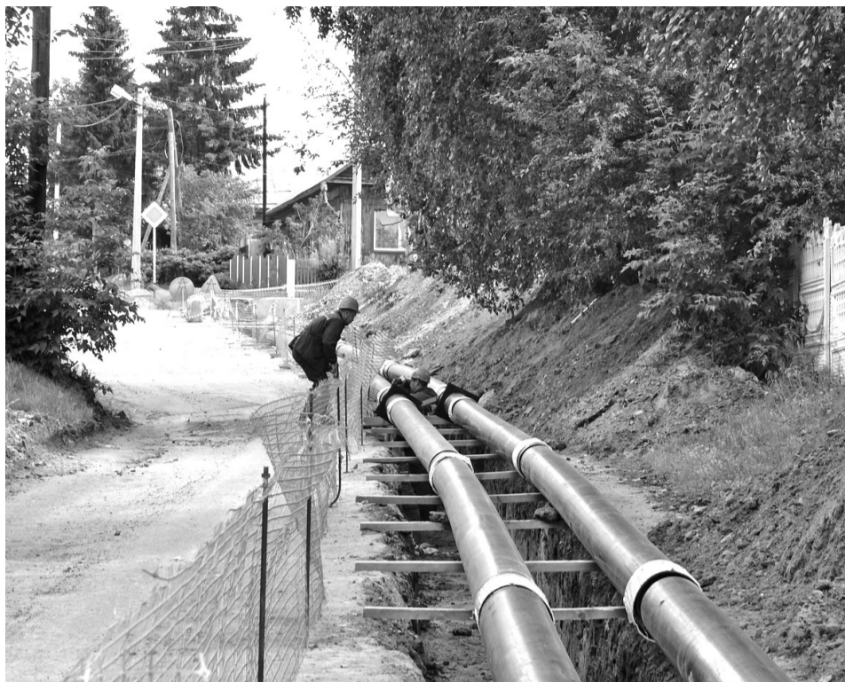
• Слесари Сибирско-Уральского энергетического сервиса монтируют новую теплотрассу от котельной «Лесхоз» до детского сада на городской улице Ермака.

Лето для работников жилищно-коммунальной сферы – горячая пора. Ремонты энергоустановок и сетей, наладка оборудования, испытания систем теплоснабжения, проверка приборов и, как конечный результат, паспорт готовности к предстоящему отопительному сезону.