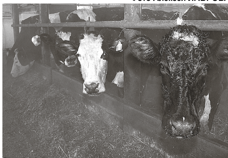
* Бурёнки получают микс из грубых и сочных кормов.