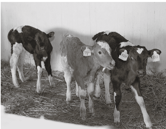
* «Мы маленькие дети! Нам хочется гулять!»