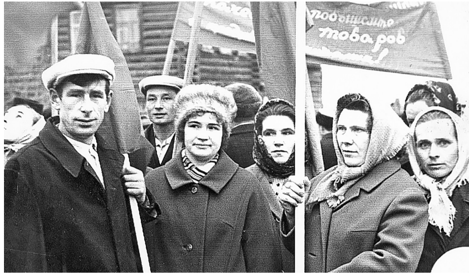
Дружным коллективом выходили труженики завода на Первомайскую демонстрацию.

Масло возили на Тюменский гормолзавод. Была одна машина. Грузить начинали в четыре часа, когда село ещё спало. Летом было сложно: закрывали коробки простынями и ватными одеяла-