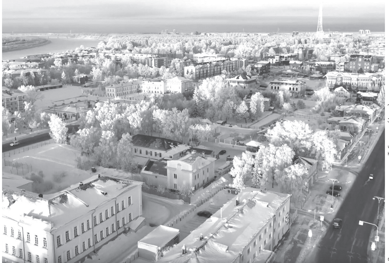
Департамент градостроительства Тобольска (фото)

В приёмную обращаются с вопросами различного характера. «Что же теперь делать? Как найти выход из