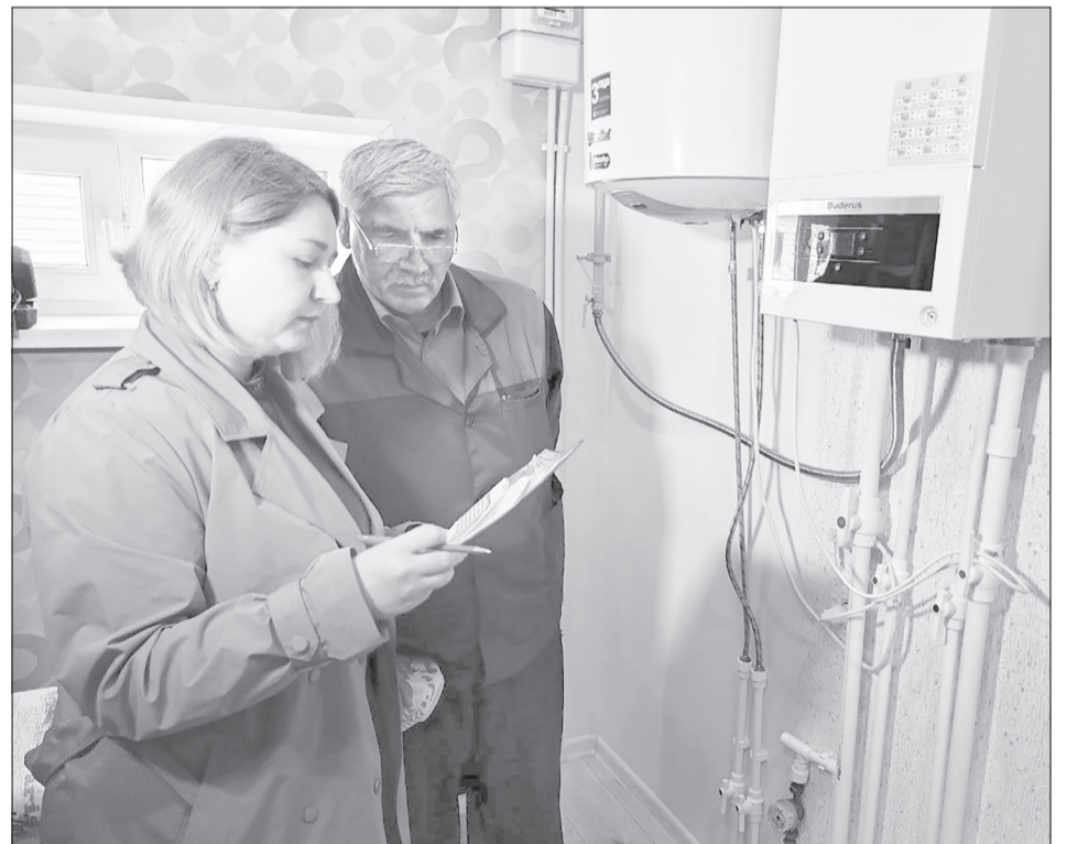
Контрольная сверка показаний счётчиков - один из способов учёта потребления воды

- Выявлено пять несанкционированных подключений, составлены акты. Есть абоненты, на счётчиках которых отсутствуют пломбы. Работаем в этом направлении, чтобы улучшить на-