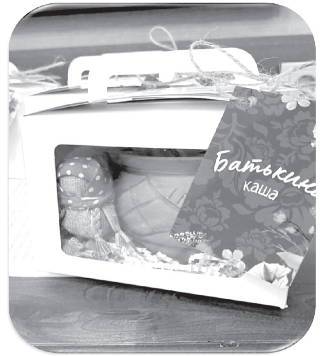
К фестивалю готовят сувенирные наборы, состоящие из куклы, наполненной крупой, и горшочка для каши /СЛАЙД ИЗ ПРЕЗЕНТАЦИИ КОМИТЕТА ПО КУЛЬТУРЕ И ТУРИЗМУ

Ждут туристов. Продвижение проекта началось в прошлом году. Он был презентован на XIII Евразийском ивент-форуме, на Всероссийской премии «Туристические города», Всероссийском туристическом форуме «Путешествуй» на ВДНХ, форуме «Россия вдохновляет на путешествия». На данный момент 35 туроператоров Уральского федерального округа и три из Москвы и Санкт-Петербурга предлагают посетить фестиваль. Туристические группы уже формируются.