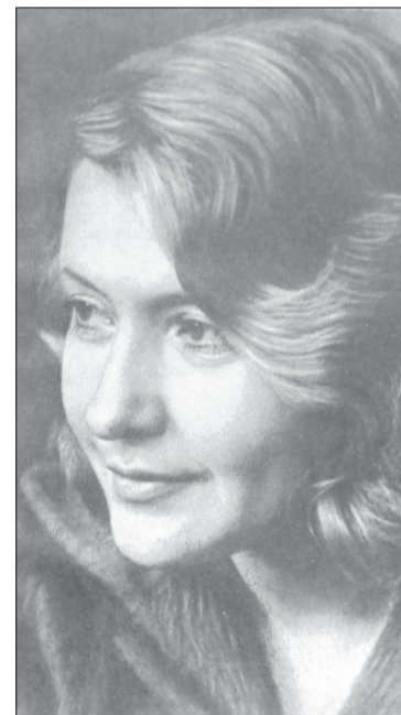
Пережитое на войне стало сквозной темой творчества Юлии Друниной