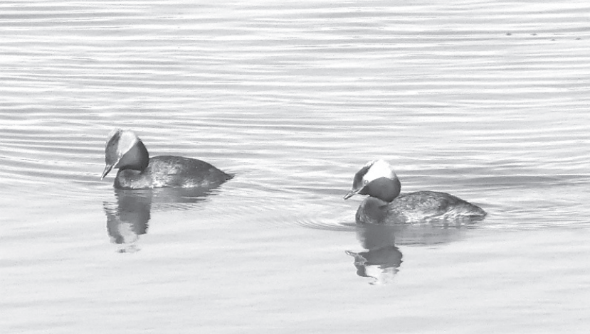
▲ Красношейная поганка обнаружена на ЗабСибНефтехиме