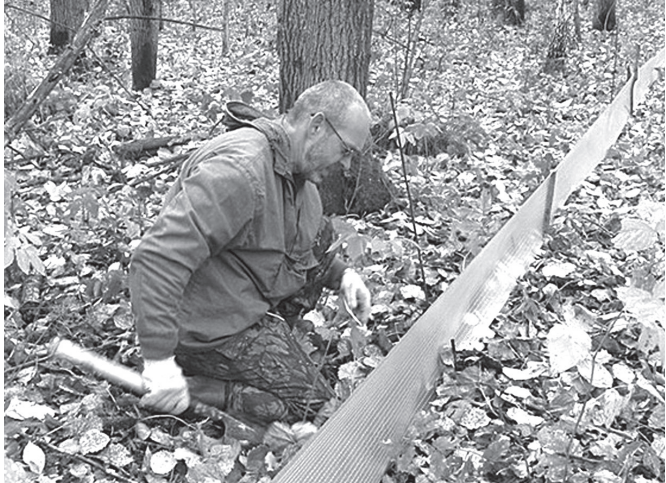
● Установка ловчего заборчика для количественного учёта землероек

Так, например, специалисты ботаники зафиксировали произрастание более десятка видов сосудистых растений, занесённых в Красную книгу Тюменской области, в том числе считавшихся исчезнувшими с территории области, а также редкие и исчезающие.