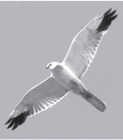
▲ Степной лунь

– К птицам, которые сохранились из предыдущего варианта спи-