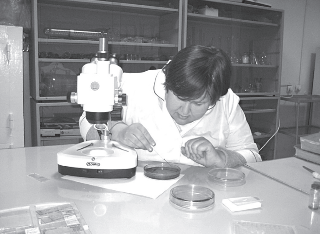
● Разбор проб и определение насекомых

Во время своего рабочего визита на «ЗапСибНефтехим» в декабре 2020 года Президент РФ Владимир Путин признал высокий уровень его экологической безопасности, который стал возможен при непосредственном участии учёных главного академического учреждения города. «Важно то, что деятельность завода полностью отвечает российским и международным природоохранным нормам. На предприятии налажен экологичный способ производства, – обратил внимание глава государства в ходе совещания по стратегическому развитию нефтегазохимической отрасли в Тобольске. – Пользуясь