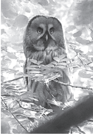
● Взрослая бородастая неясыть на восточном фоновом участке

Также в границах строящегося объекта было зарегистрировано пребывание таких редких охраняемых видов птиц, как обыкновенный осоед, орлан-белохвост и сплюшка. На сегодняшний день все они занесены в Красную книгу Тюменской