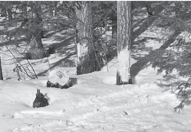
● Свежие погрызы осины речным бобрим