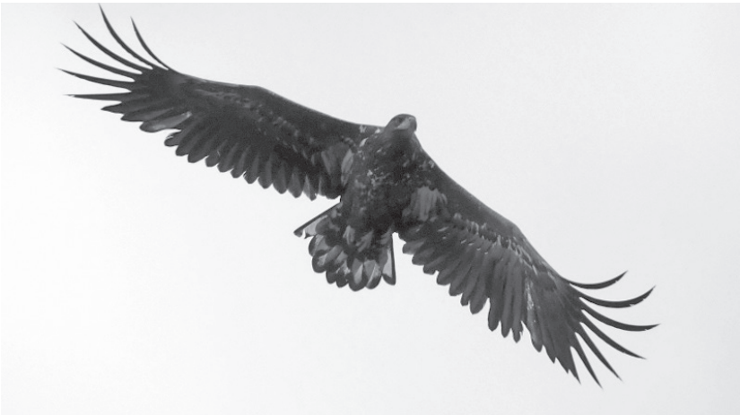
▲ Орлан обнаружен на «ЗабСибНефтехиме»

родоохранный аспект. К слову, оба указанных вида птиц занесены в региональную и федеральную Красные книги.