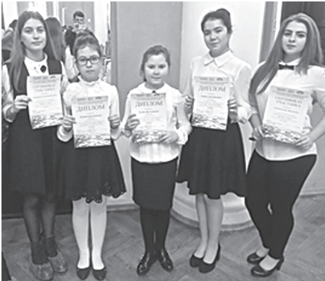
✎ Научно-практическая конференция «Мы живём в Сибири»