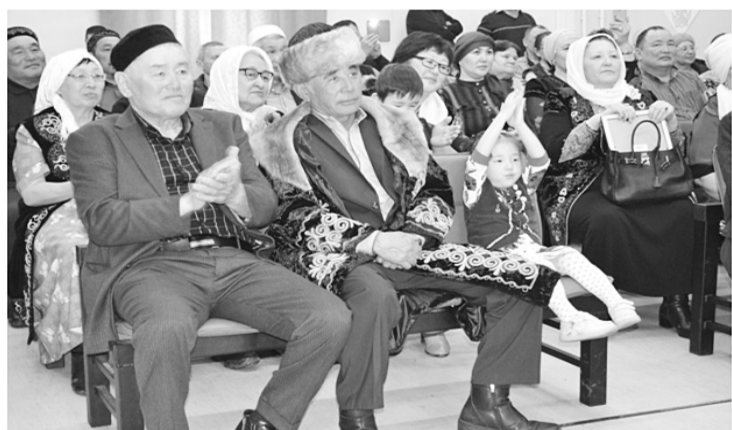
В день весеннего равноденствия Наурыз радовал яркими красками национальных костюмов, песнями, танцами...