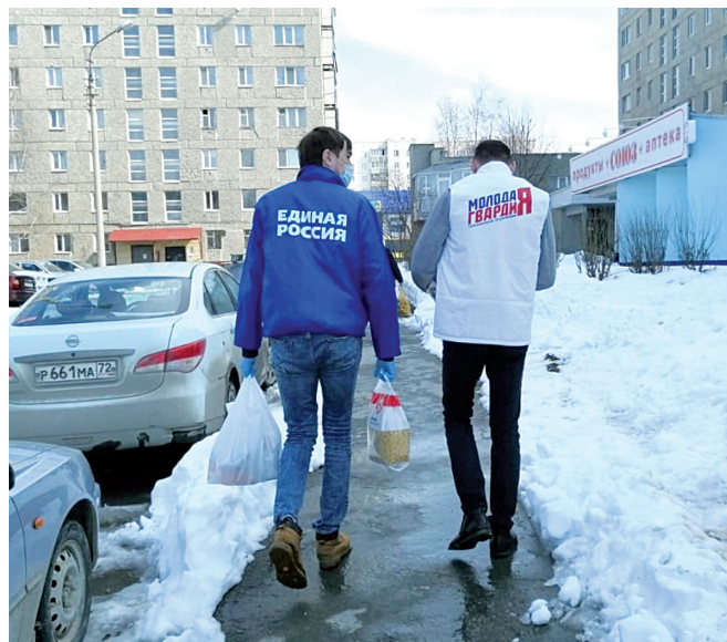
☞ подпись ???