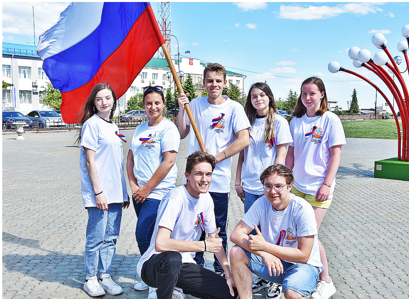
Участники акции – активная, жизнерадостная, целеустремлённая молодёжь

Накануне праздника – Дня России в центральном парке старшекласники Казанской школы провели акцию «Люблю тебя Россия». Ребята рассказывали прохожим о празднике, раздавали им ленты триколор и буклеты, в которых изображены герб и флаг России, напечатан гимн РФ. В день государственного праздника, 12 июня, в центральном парке села Казанского пройдёт масса развлекательных мероприятий. В 10 часов 30 минут для детей станут работать тематические и игровые площадки, кафе.