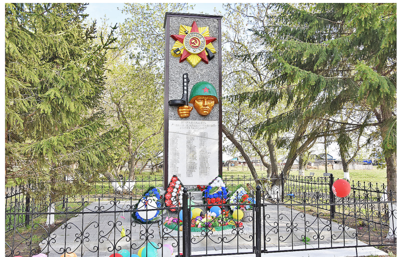
Яровчане чтят память о воинах-земляках, завоевавших мир и свободу