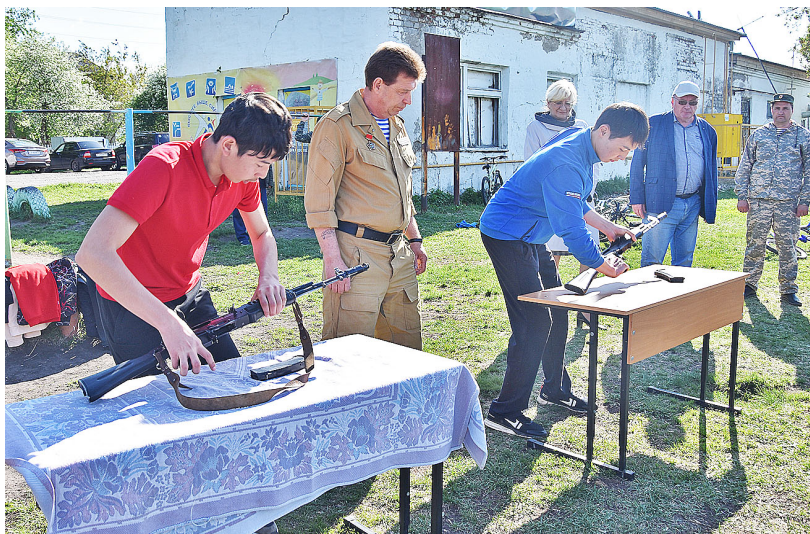
Юноши продемонстрировали хорошие результаты при разборке и сборке автомата

В часы досуга юноши играли в баскетбол, футбол, волейбол, смотрели военно-патриотические фильмы, участвовали в викторинах «История России», «Истории Вооружённых сил РФ».