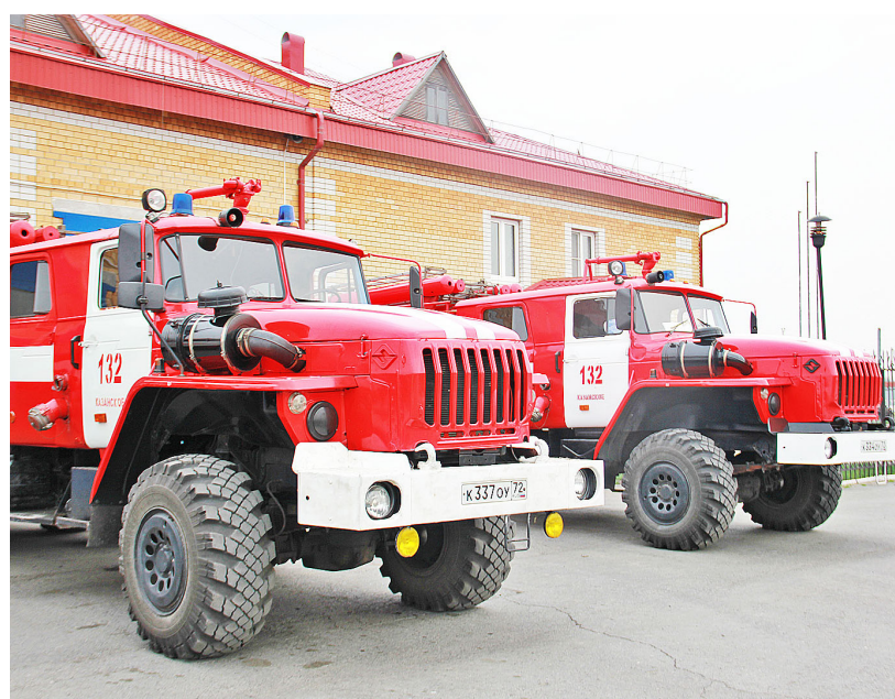
С начала текущего года сотрудники пожарной части выезжали 66 раз на тушение пожаров

Огромной проблемой для нашей страны и особенно для Сибири являются лесные пожары. Неконтролируемое горение растительности и стихийное распространение огня по площади леса приводят к трагическим последствиям. Поэтому кодексом об административных правонарушениях предусмотрена отдельная статья, устанавли-