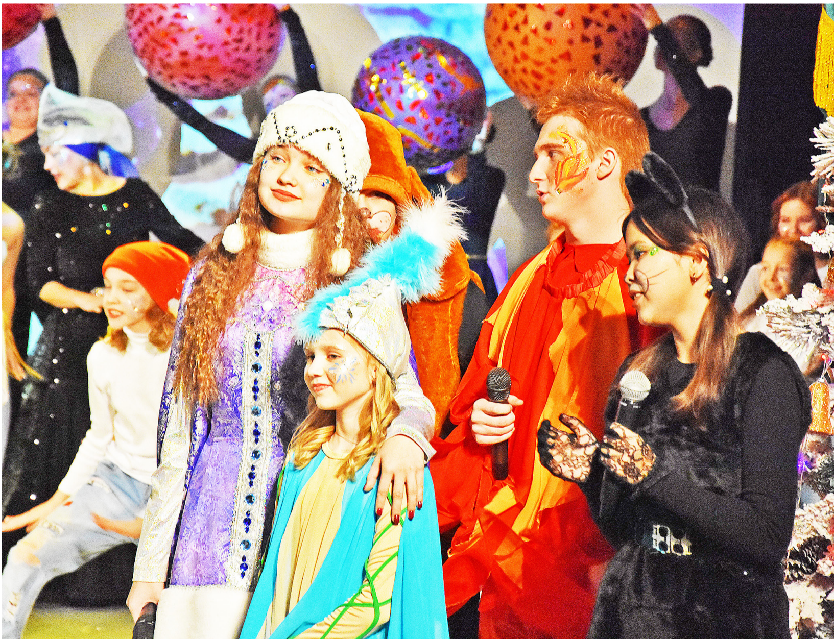
Пусть Новый год принесёт всем детям яркие впечатления и много радости

Новый год – самый яркий и запоминающийся праздник, он приносит ощущение счастья и веселья. Посмотреть волшебную музыкальную феерию «Синяя птица» и погрузиться в новогоднюю сказку были приглашены 213 отличников, активистов, победителей конкурсов и спортивных соревнований из школ Казанского района. В тот же день Ёлка главы состоялась и для детей мобилизованных земляков.