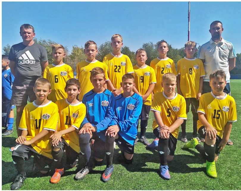
Футбольная команда «Чайка»