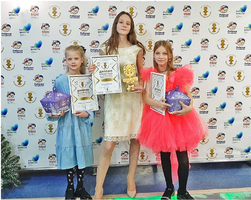
Финалисты премии «Золотой Нафаня»