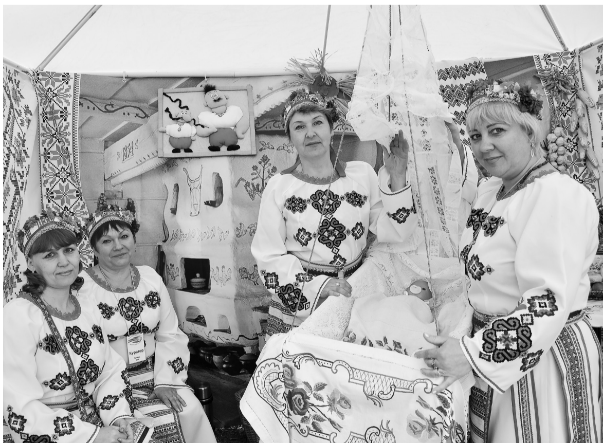
Национальное подворье всегда было отличительной чертой украинской диаспоры.

хуторе близ Диканьки». В семье Скрипник, к примеру, книг на украинском языке очень мало. Букварь имеется, а так же сборник сказок. Когда внук был лет четырёх от роду, ему читали истории о забудькуватим (забывчивом) Фунтике, который потерял свою косточку и искал её. Конечно, вдалеке от Родины не просто прививать культуру молодому поколению, так как даже окружение предполагает знание другого языка, других традиций и мировоззрений. Так что у внуков такая рьяная тяга к культурному наследию родного народа сама собой может иссякнуть.