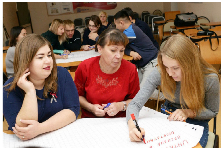
Участники встречи - молодые родители - работают в группе. Они пишут проблемы, которые, по их мнению, являются препятствиями для радостного материнства: насилие в семье, интернет-зависимость, плохие жилищные условия и другие