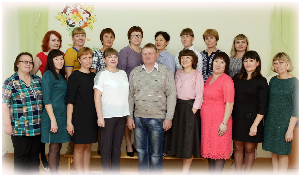
В «Звёздочке» трудится сплоченный коллектив