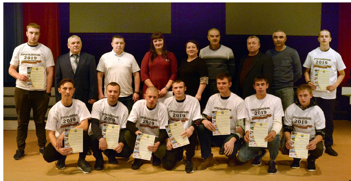
Призывники с руководством района и воинами-интернационалистами