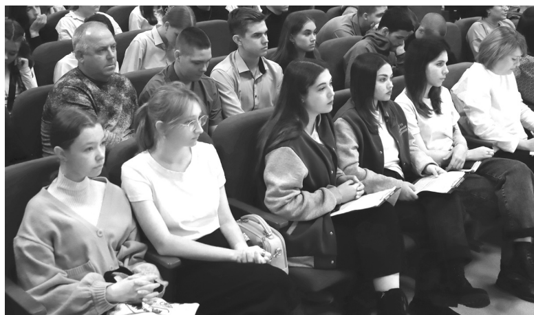
На ярмарке учебных мест дали возможность побывать всем старшеклассникам Голышмановского округа