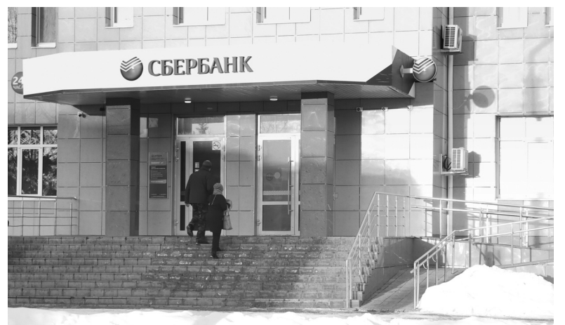
На ступеньках и поручнях лестницы, дверях допифиса Сбербанка нанесли контрастную маркировку для слабовидящих

В номере 91 нашей газеты от 13 ноября мы опубликовали материал «В поисках безбарьерной среды».