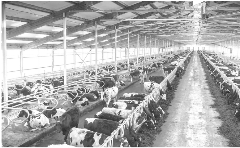
Сытая зимовка животным ООО «Тюменские молочные фермы» обеспечена

Работники «Тюменских молочных ферм» выращивают