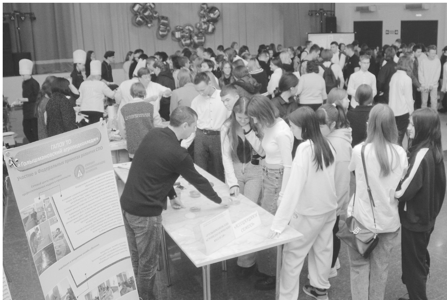
На мастер-классах ребята попробовали себя в разных профессиях

В посёлке Голышманово прошла ярмарка учебных мест для учащихся 9-х и 11-х классов школ округа