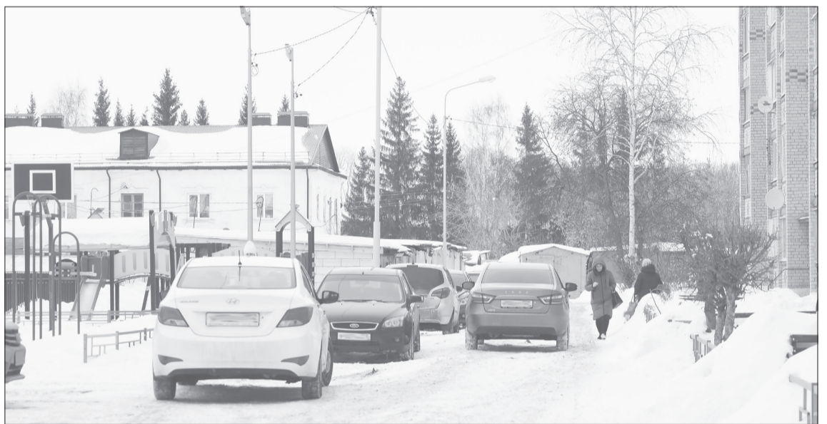
Жильцы дома № 40 на ул. Заводской недовольны, что центральный вход в детский сад расположен в их дворе

Разница начислений объясняется тем, что у каждого дома своя теплопроводность. Котельные топят так, чтобы было комфортно всем. Вот и выходит, что у некоторых горожан дома жарко, они открывают форточки и, получается, платят за обогрев улицы. По словам заместителя главы, чтобы сэкономить, нужно поставить краны на батареи и регулировать подачу тепла индивидуально. У ресурсонабжающей организации есть график, где указаны температура окружающего воздуха и соответствующие ей градусы