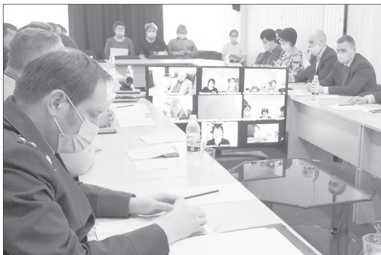
Первое в этом году заседание районной думы частично прошло в формате видеоконференции

Новости города и района на сайте yalutorovsk.online и в социальных сетях