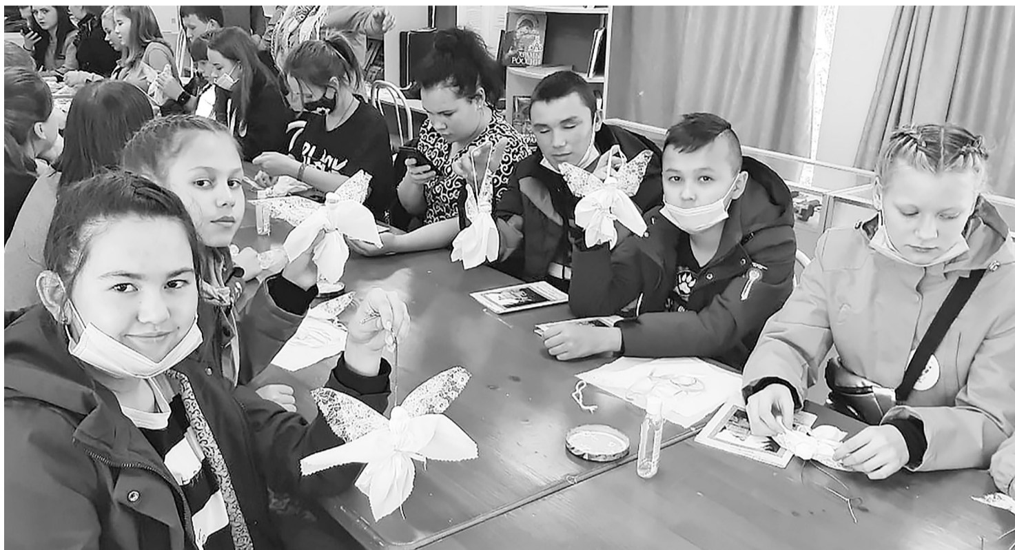
Не только ребята из Нижней Тавды, но и воспитанники Кунчурской школы приняли участие в мастер-классе по изготовлению ангелов для онкобольных детей. Подобные мероприятия учат быть сострадательными.

Среди 68 ребят района 20 воспитанников из Нижнетавдинской средней школы. После окончания поездки я встретился с