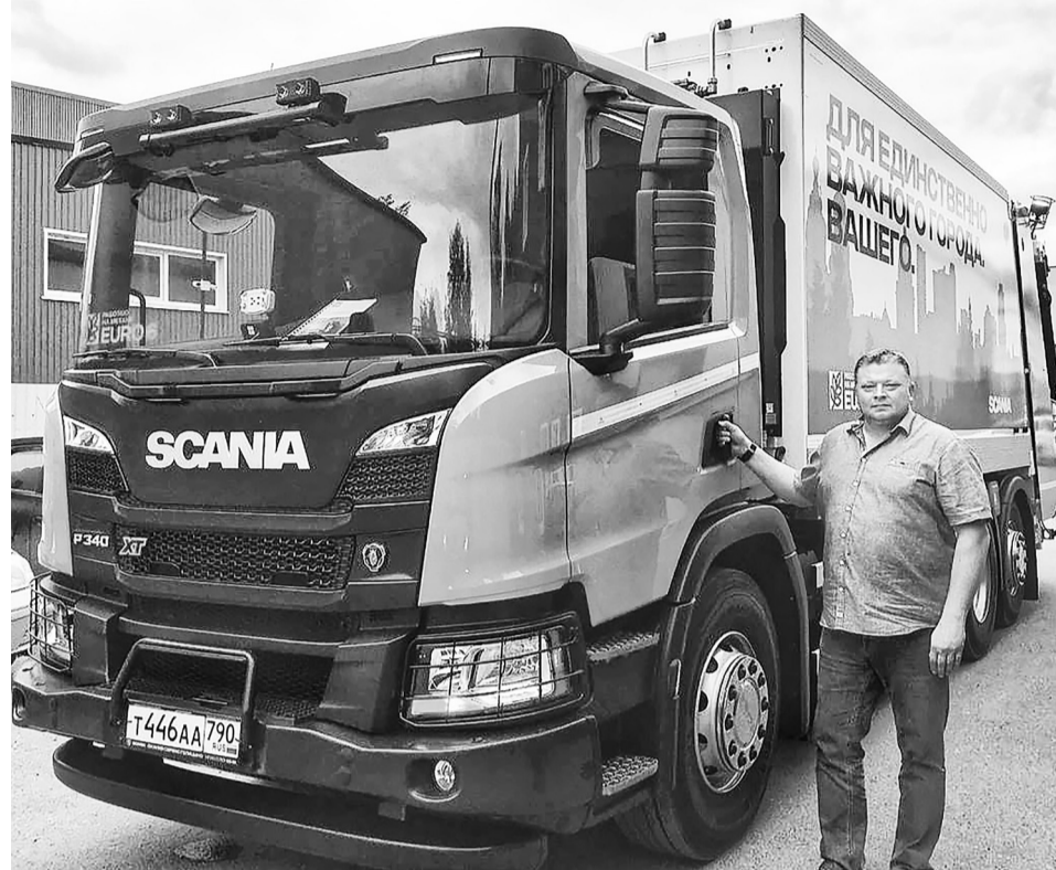
Современный мусоровоз Скания позволяет эвакуировать твёрдые бытовые отходы из труднодоступных мест.

В рамках эксперимента большое внимание уделяется таким характеристикам, как грузоподъёмность, мощность, скорость автомобиля, маневренность в стеснённых городских условиях. Также