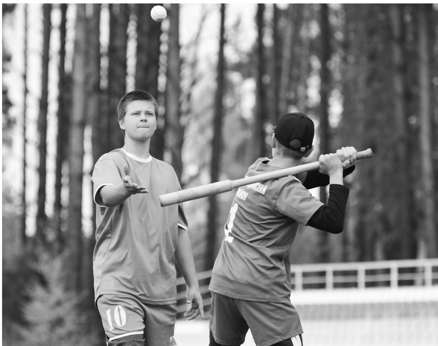
Команда Нижнетавдинского района вводит мяч в игру.