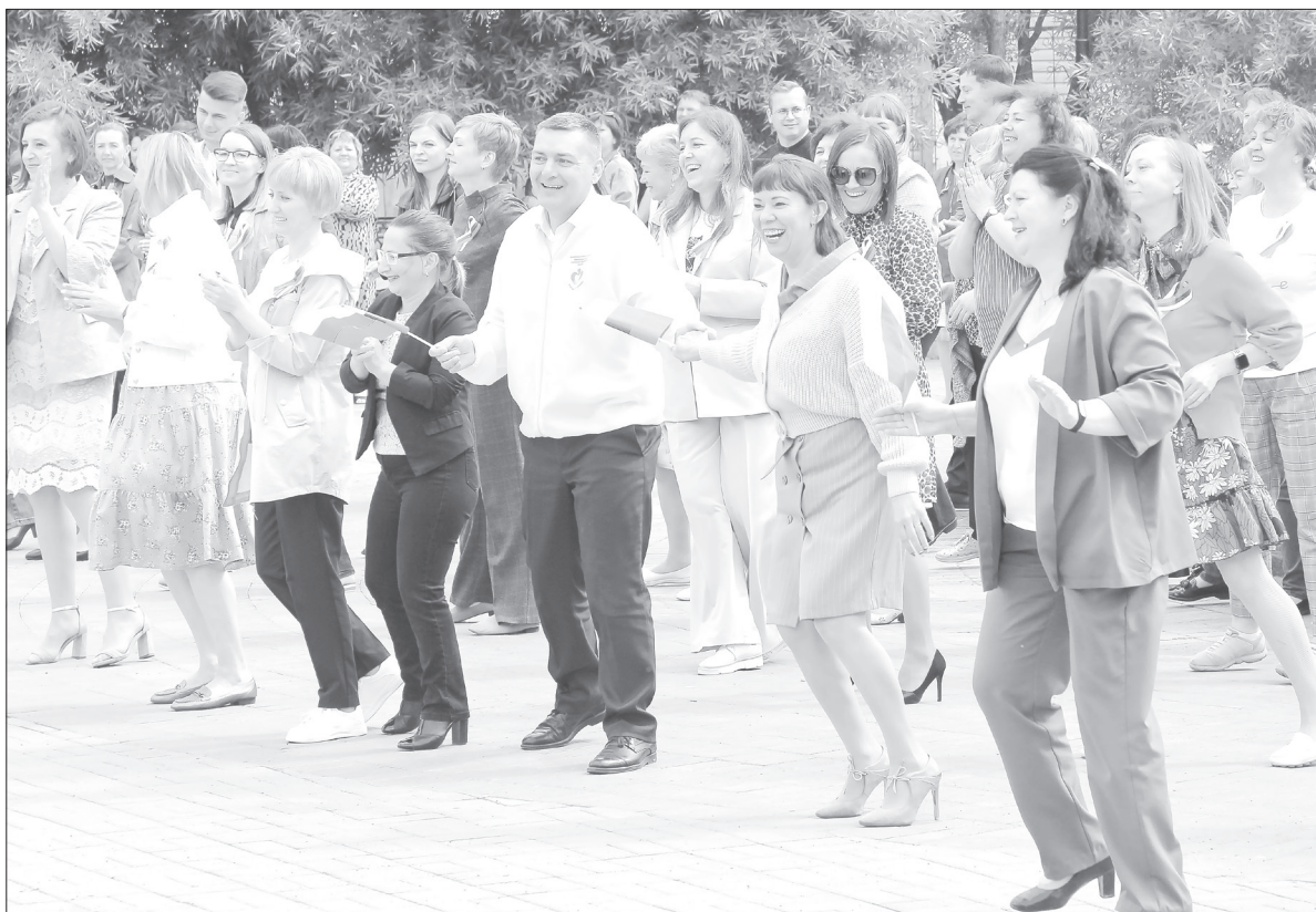
Для участия во флешмобе главное - хорошее настроение