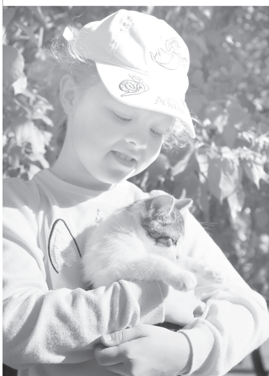
12 июня в городском саду жителей и гостей Ялуторовска ждет праздничная программа. Подробнее - в группах «Ялуторовск знает»

Уважаемые жители Уральского федерального округа! Рад поздравить вас с праздником – Днём России!