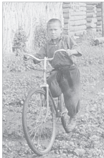
Варис Амиров на велосипеде. 1960-е годы