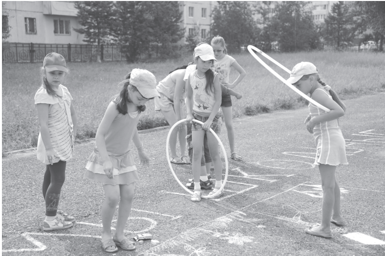
Подвижные игры на свежем воздухе (фото из архива)

Комитет по физической культуре и спорту планирует открытие трёх лагерей с дневным пребыванием на базе семи спортивных комплексов и двух обще-