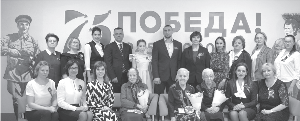
В школе № 16 чествовали тружеников тыла