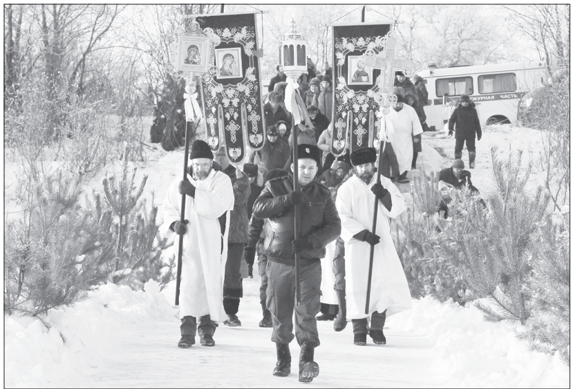
Несмотря на мороз, православные прошли около 1,5 км Крестным ходом от собора до купели

Православные ялуторовчане отметили один из двенадцати праздников