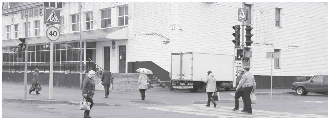
Без диагональной разметки переход перекрёстков с угла на угол считается нарушением ПДД

Ещё одно «горлышко» - у отдела полиции. Каждую зиму из-за ледового городка сокра-