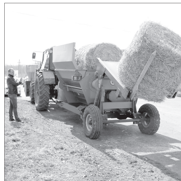
Минута на загрузку - и рулонный измельчитель готов к работе

По питательности добавки приравниваются к кормам животного происхождения, мясокостной и рыбной муке. Их белок переваривается в организме на 95%. Фосфор, кальций и магний, находящиеся в составе, способствуют нормальному развитию скелета. Штаммы вырабатываются на древесном сахаре, полученном из опила, поэтому финальный продукт - экологи-