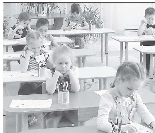
В номинации «Познавательное развитие» проверялись кругозор и логическое мышление

■ СПРАВКА. Муниципальная олимпиада дошкольников прошла в Ялуторовске в седьмой раз. Маленьких знаток в этом году принимал «девятый» детский сад.