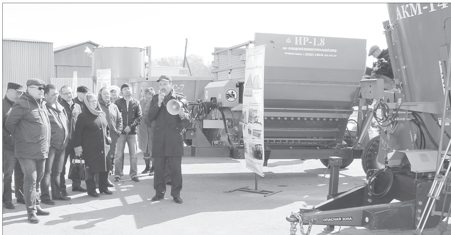
Участники выставки интересовались производственными тонкостями представленной техники, а животноводы из Ярково решили, что приобретут её в ближайшее время