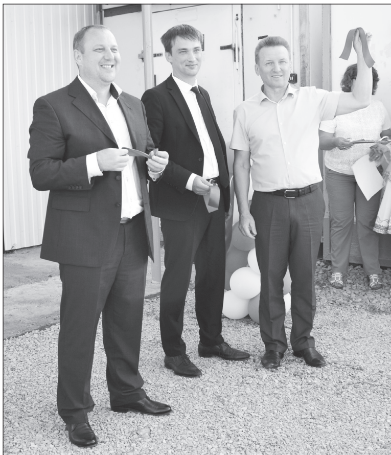
В Упоровском районе цех построен и открыт одним из первых в области.

В начале текущей недели в деревне Тютриной состоялось открытие убойного цеха. С 15 августа специалисты кооператива «Исток» проводят ветеринарно-санитарную экспертизу, осуществляют убой и принимают скот.