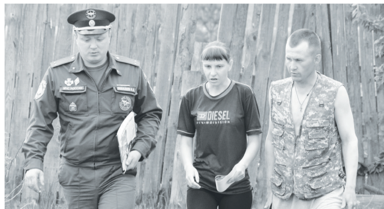
Сегодня надзорными органами проводятся внеплановые рейды по проверке придомовых территорий граждан.

– Всего с 3 апреля на общую сумму более двухсот тысяч рублей было составлено 19 протоколов за нарушения требований действующего режима чрезвычайной ситуации, в том числе одно – на должностное лицо. В основном причиной наложения санкций