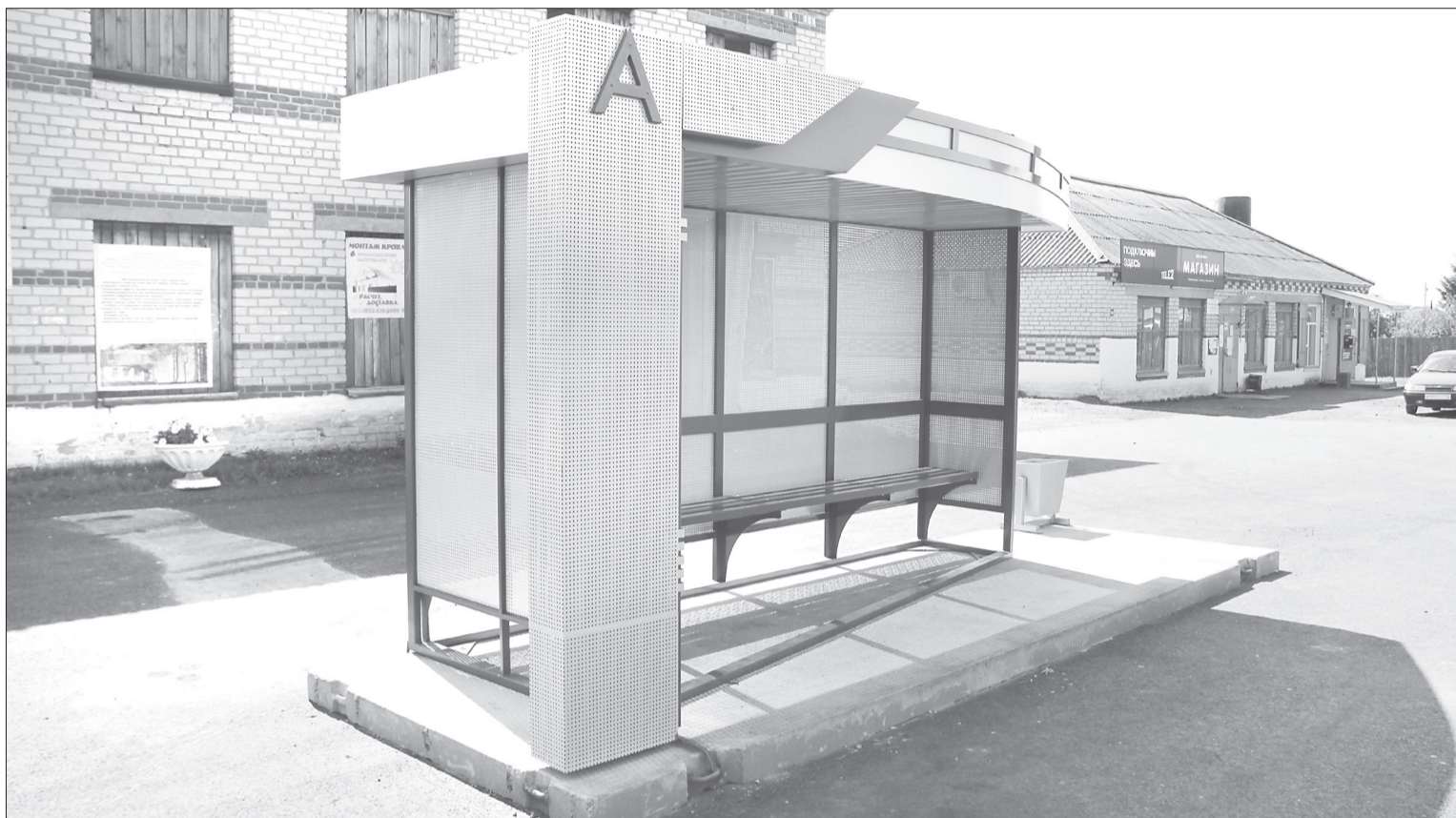
В Хохлово дорожники обновили центральную площадь возле ДК, покрыв её новым асфальтом, а также установили здесь современный, комфортный павильон автобусной остановки