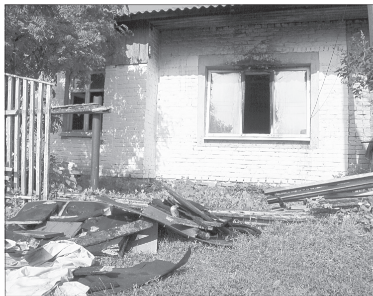
Дом удалось отстоять, но помещения получили повреждения - сгорели потолочные перекрытия и обрешётка крыши на площади шести квадратных метров

жина в Сингуле Татарском была сформирована в июле 2020 года. Она состоит из четырех человек - двух действующих пожарных и двух пенсионеров. Уже несколько раз команда самостоятельно выезжала на тушение ландшафтных возгораний на территории села.