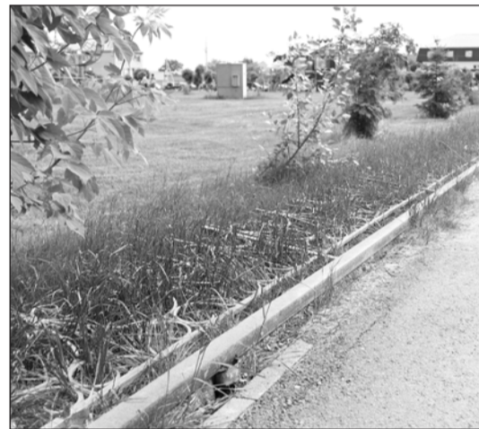
Парк теперь без ограждения