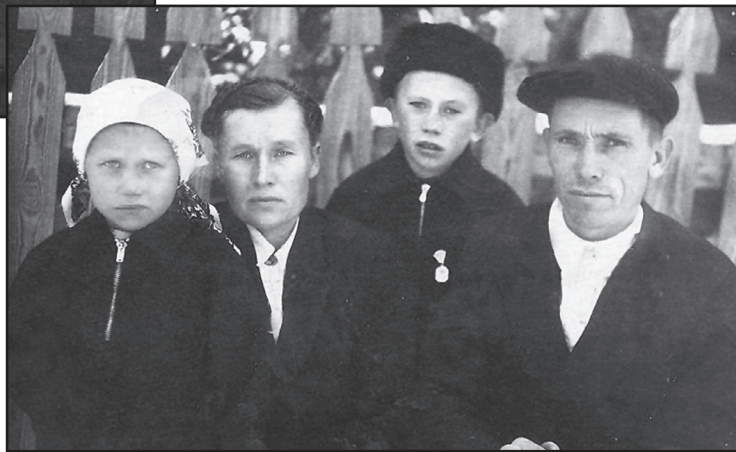
С мужем и детьми