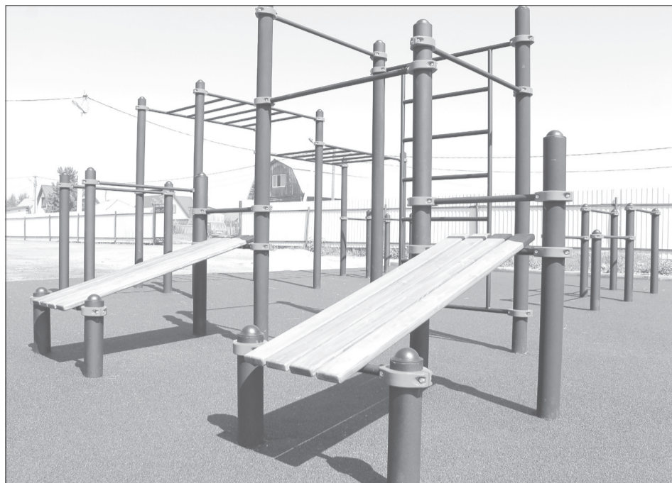
Уличные тренажёры нового спортивного комплекса нацелены на работу с собственным весом

Инициативный проект. Строительство в селе площадка для принятия нормативов Всероссийского физкультурно-спортивного комплекса «Готов к труду и обороне» - инициатива местных жителей. С ней весной этого года сельчане обратились в спортивную школу, а та в свою очередь - в администрацию Ялуторовского райо-