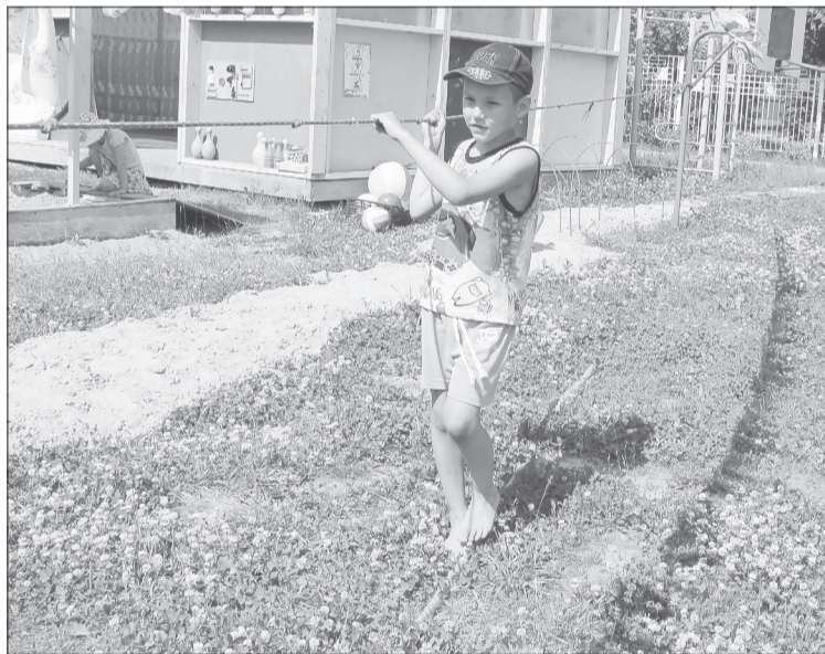
Ходьба по канату на туристической тропе развивает у детей умение держать равновесие, ловкость, быстроту реакции

■ СПРАВКА «ЯЖ». Абилитация - это лечебно-педагогические, социальные мероприятия, которые направлены на развитие способностей к бытовой, общественной, профессиональной и другой деятельности.