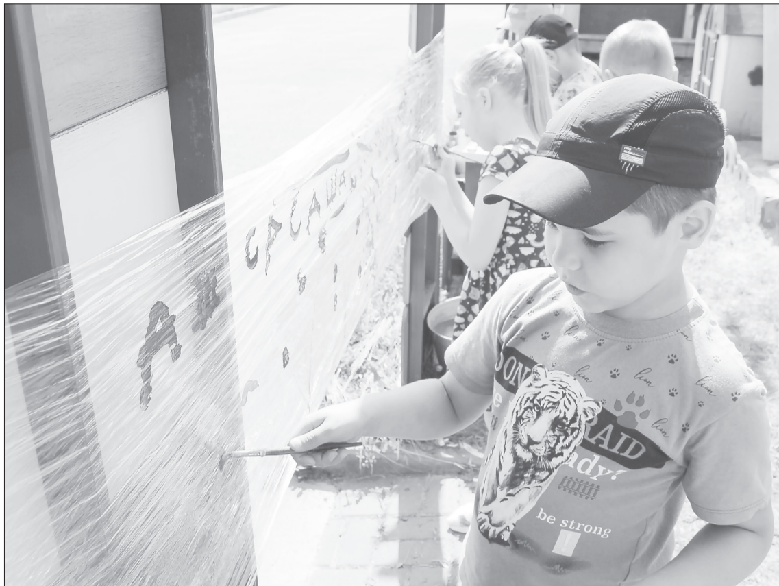
Пищевая плёнка - удобный материал для рисования. Гуашь не растекается, а «холст» можно быстро заменить, отмотав от рулона нужный размер

Работа продолжится. В этом году детский сад № 8 посетают 42 ребёнка с ограниченными возможностями здоровья и инвалидностью. У малышей