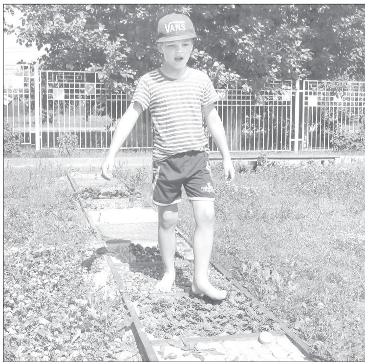
Сенсорная дорожка - для профилактики плоскостопия и укрепления здоровья детей. Одолеть её с первого раза может не каждый