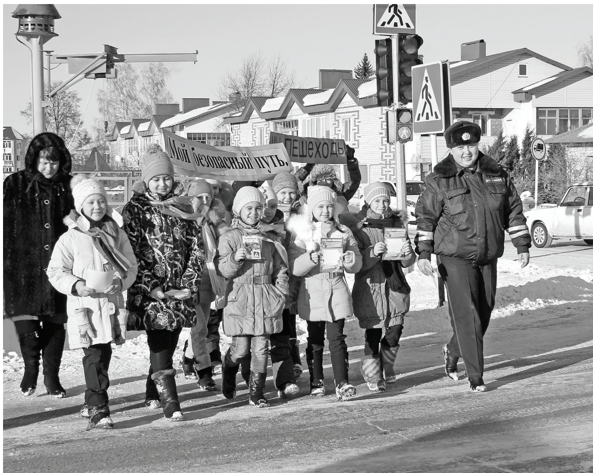
Мы соблюдаем правила дорожного движения! А вы?

Был отмечен и положительный результат. Проверкой установлено, что все маленькие пассажиры Нижней Тавды перевозились с использованием дет-