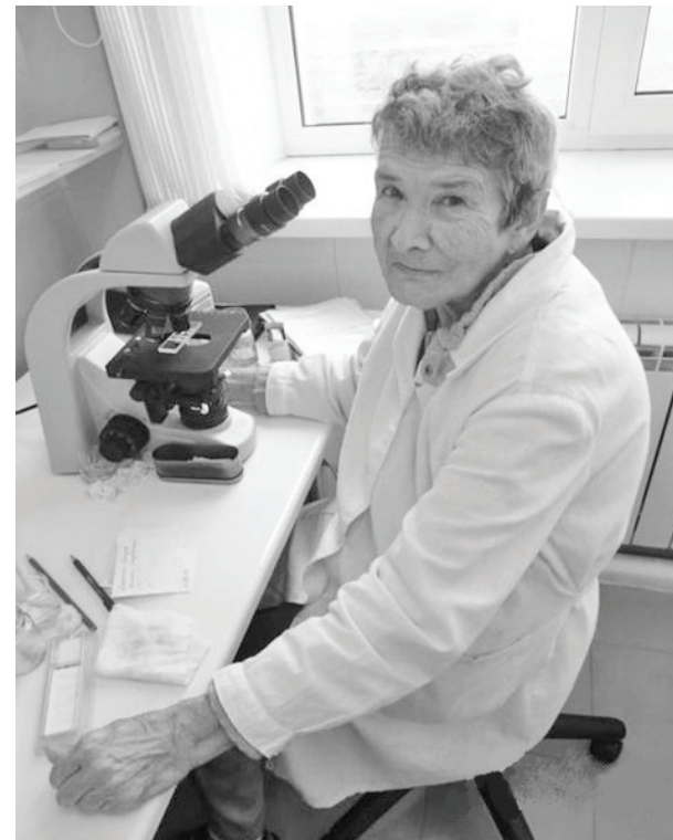
На рабочем месте в Бухтальской больнице.

то, что ты делаешь, тогда и отдача будет, и работа пойдёт.