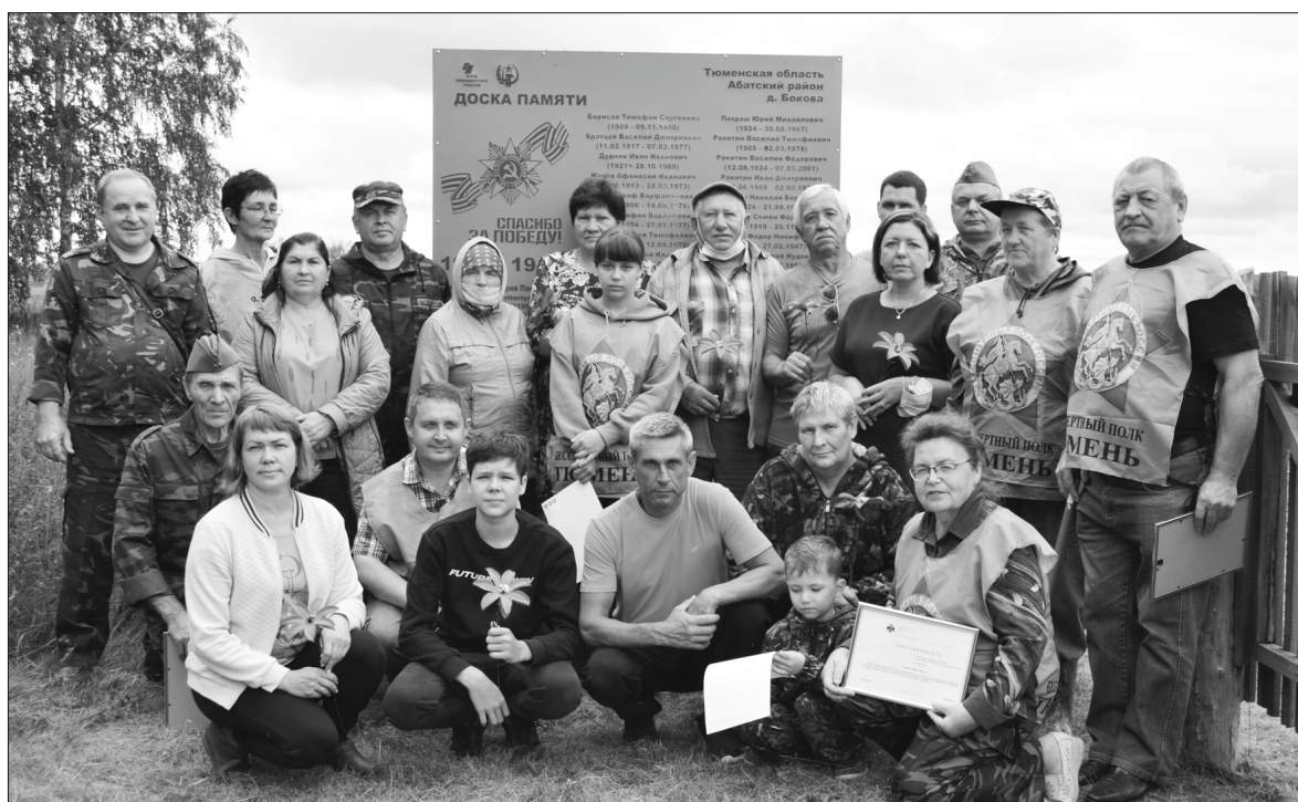
Установление доски памяти на территории кладбища в д. Боковой