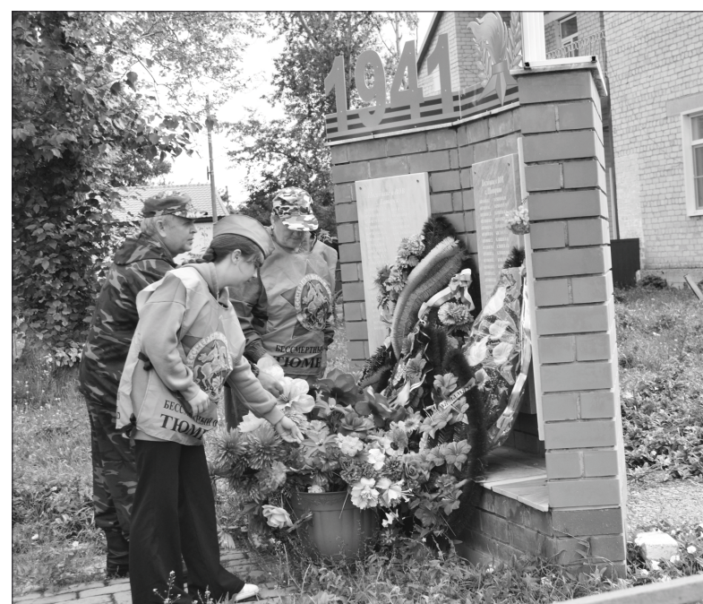
Возложение цветов к памятнику в с. Шевырино

ях сельских поселений были установлены 20 информационных стендов - «Доска памяти» с фамилиями участников войны, захороненных на погостах в послевоенный период.