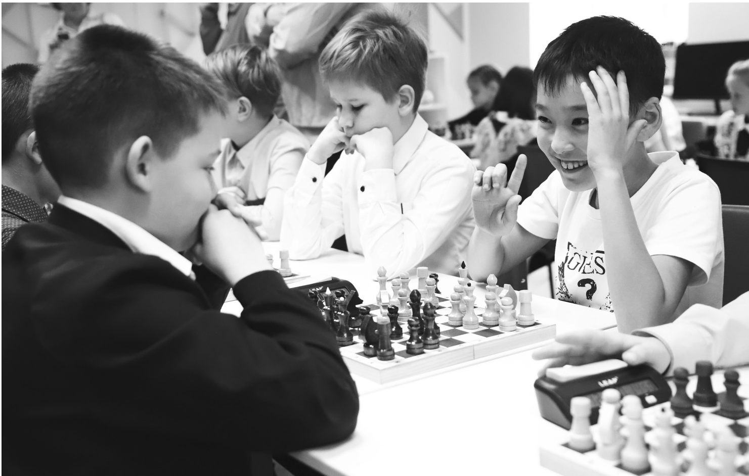
И вдруг юный шахматист понял, какую тактическую комбинацию замыслил соперник