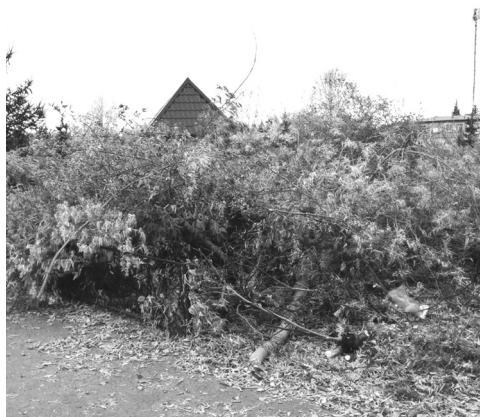
Рядом с парком отдыха спилили клёны. И творят, что хотят, только опилки летят

В тот день долго не смолкали бензопилы в центре посёлка Голышманово. И звучание их было печальным, как и миссия, которую они выполняли. Сколько деревьев в считанные часы здесь «пали смертью храбрых»? Наверное, никто даже и не посчитал.