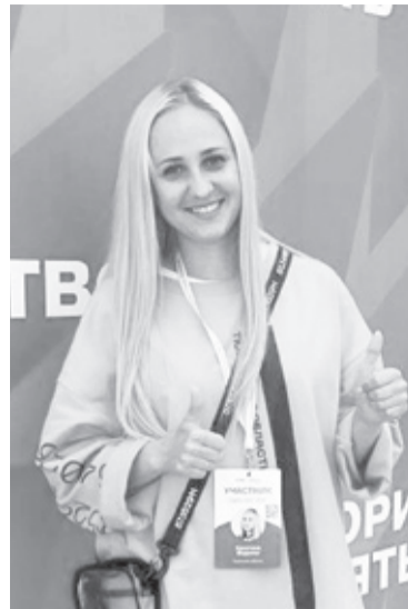
И Фото Кристины Мадиевой

Педагог приняла участие в Классной встрече с советни-