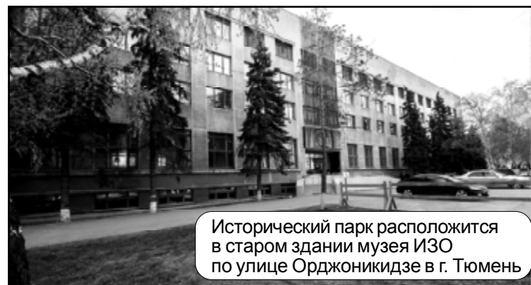
Исторический парк расположится в старом здании музея ИЗО по улице Орджоникидзе в г. Тюмень

Рабочее совещание по реализации проекта создания в Тюмени исторического мультимедийного парка «Россия – моя история» прошло в рамках поездки главного советника Управления Президента Российской Федерации по внутренней политике Романа Балашова.